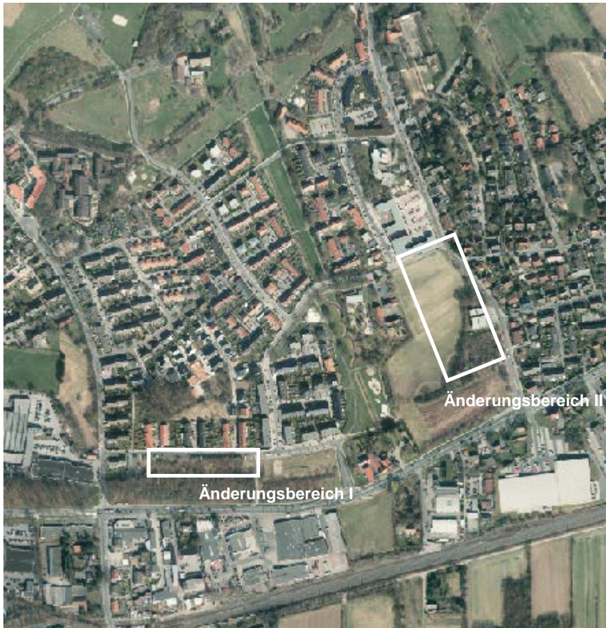
Abbildung 1: Räumliche Einordnung der Geltungsbereiche

Die Grenzen des räumlichen Geltungsbereichs der Änderung sind im Plan durch einen grauen Farbstreifen gekennzeichnet.