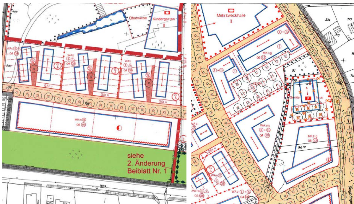
Abbildung 2: Festsetzungen im Änderungsbereich I (links) und II (rechts)

Der Änderungsbereich liegt im rechtskräftigen Bebauungsplan Nr. 396 in der Fassung vom 10.11.1995. Dieser Bebauungsplan setzt den Änderungsbereich I sowie einen Großteil des Änderungsbereichs II als Kerngebiet fest. Im Änderungsbereich II sind zudem im nördlichen Bereich eine sportlichen Zwecken dienende Fläche für den Gemeinbedarf mit Zweckbestimmung ‚Mehrzweckhalle‘ und nord-westlich der Grünschneise ein allgemeines Wohngebiet festgesetzt.