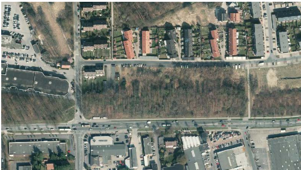
Abbildung 3: Luftbild Änderungsbereich I (Stand 2011)

Südlich an den Änderungsbereich I grenzt eine bewaldete Fläche an, die den Bereich von der Weseler Straße (B 51) abschirmt. Die Kronen der Bäume ragen in das geplante Baugebiet hinein. Im Norden liegt die Meyerbeerstraße zwischen dem Änderungsbereich und der angrenzenden II-geschossigen Reihenhausbauung. Im Westen der Fläche befinden sich eine Stellplatzanlage und weitere Wohnbebauung, die an den Meckmannweg angrenzt. Dieser trennt das Gebiet von einem benachbarten Autohaus. Nach Aufgabe des Autohauses ist geplant, auch diesen Bereich zusammen mit dem angrenzenden Sportplatz zu einem Wohngebiet zu entwickeln. Im Osten bildet ein öffentlicher Fuß- und Radweg eine Verbindung zwischen Meyerbeerstraße und Weseler Straße. Da sich der Weg außerhalb des Änderungsbereichs befindet, bleibt er in seiner Funktion auch zukünftig erhalten. Der Weg trennt den Änderungsbereich von einer ihm in seiner jetzigen Prägung gleichartigen Fläche. Diese wird im Zuge der vorhabenbezogenen 6. Änderung des Bebauungsplans 396 ebenfalls mit Reihen- und Mehrfamilienhäusern überplant.