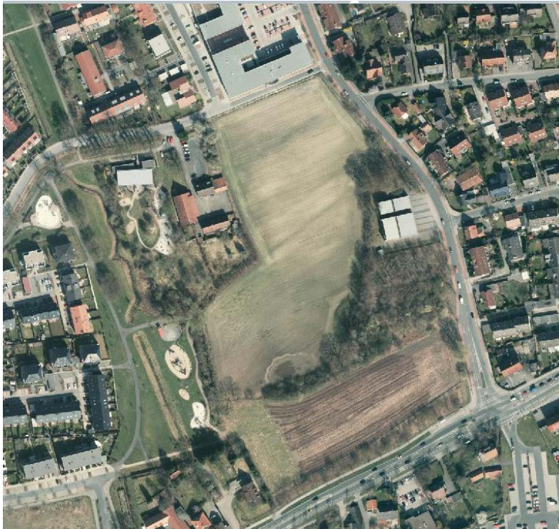
Abbildung 4: Luftbild Änderungsbereich II (Stand 2011)