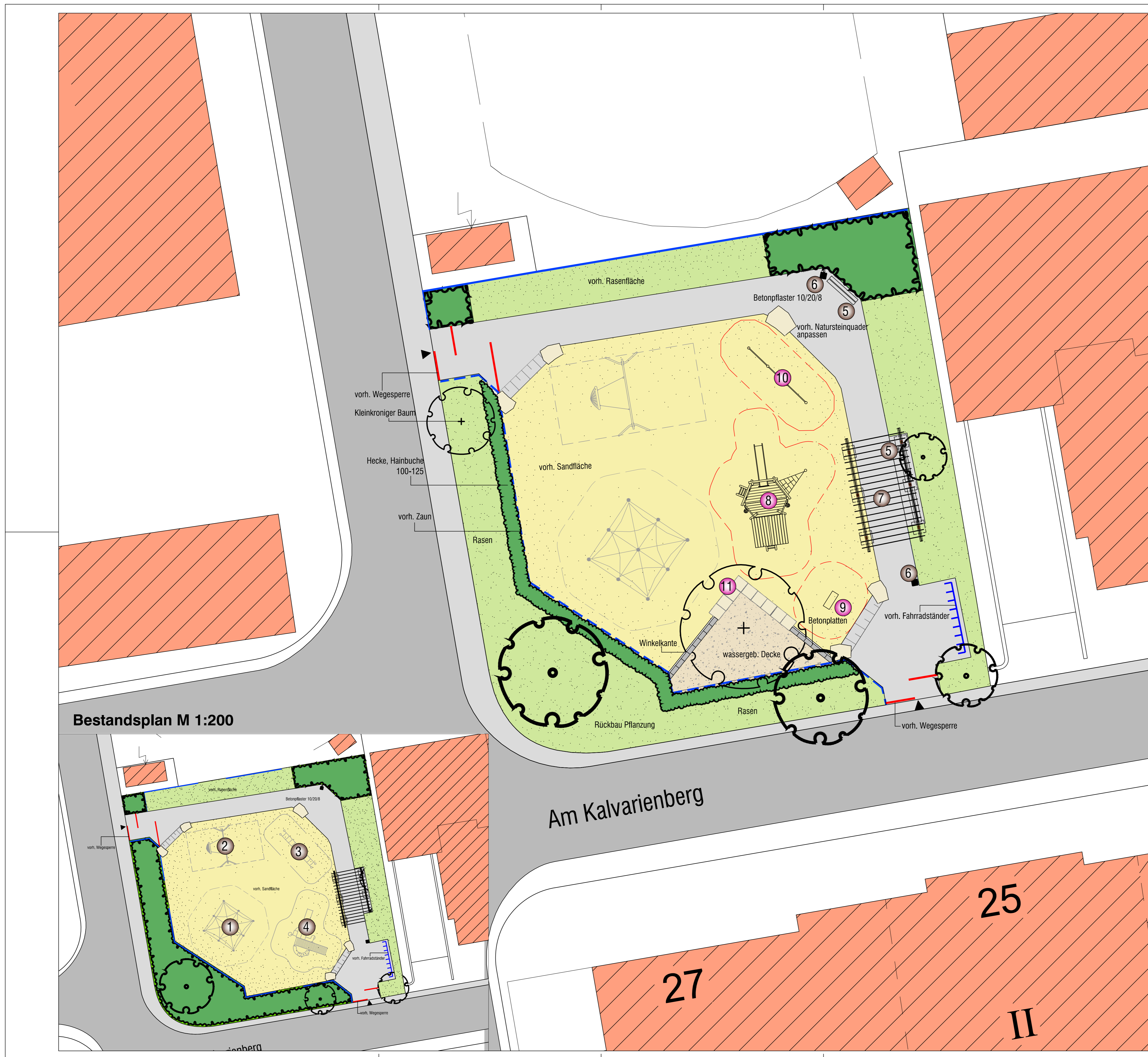
Bestandsplan M 1:200