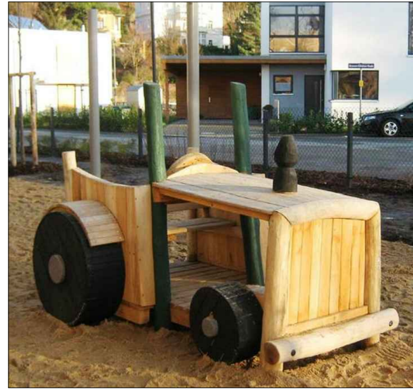
3) Traktor für Rollenspiel