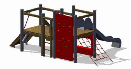
⑦ Varioset Kinderwelt geändert