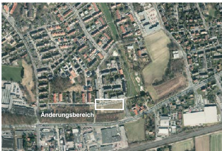
Abbildung 1: Räumliche Einordnung des Geltungsbereichs

Der Geltungsbereich der 6. Änderung des Bebauungsplanbereichs Nr. 396 umfasst den Bereich südlich des Kreuzungsbereichs der Straßen „Am Hof Schultmann“ und „Meyerbeerstraße“ zwischen dem öffentlichen Fußweg zur Weseler Straße und dem Hof Appels. Dies entspricht den Grundstücken Gemarkung Münster, Flur 227, Teile des Flurstücks 520 sowie Flur 228, Flurstücke 600, 748 und Teile des Flurstücks 602. Zusätzlich zu den Flächen des Investors, wurden damit Restflächen in den Geltungsbereich des Bebauungsplans mit aufgenommen. Diese Flächen wurden vom Investor erworben und werden den entstehenden Grundstücken zugeschlagen. Die Grenzen des räumlichen Geltungsbereichs des Bebauungsplans sind im Plan durch einen grauen Farbstreifen bezeichnet. Die Grenzen des Vorhaben- und Erschließungsplans sind im Plan durch einen violetten, unterbrochenen Farbstreifen gekennzeichnet.