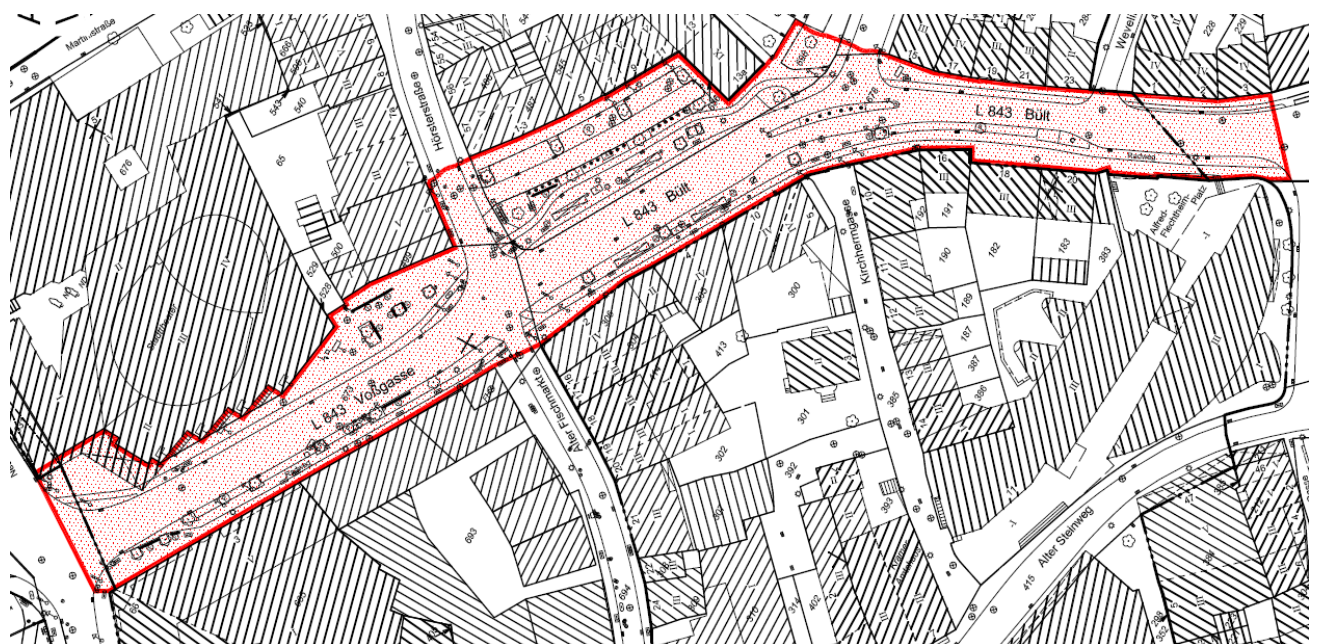
Wettbewerbsgebiet Neubrückenstraße bis Asche