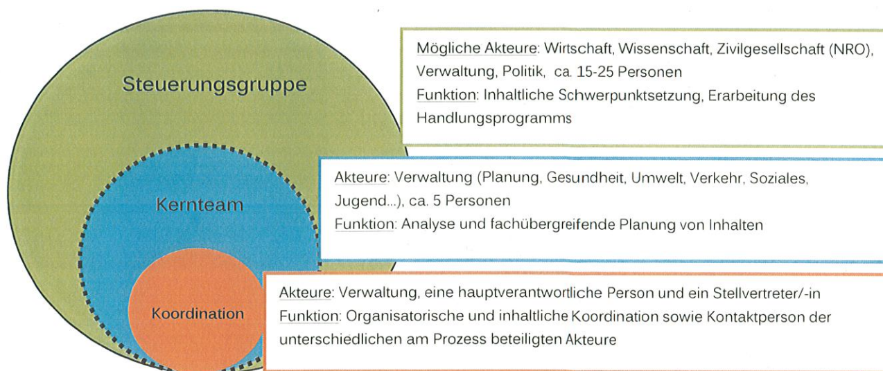
Abbildung 2: Arbeitsstrukturen zur Entwicklung einer Nachhaltigkeitsstrategie

Für die Entwicklung und langfristige Umsetzung der Nachhaltigkeitsstrategie ist es erforderlich, funktionale und verbindliche Arbeitsstrukturen in der Kommune zu etablieren. Durch die Arbeitsstrukturen werden klare Verantwortlichkeiten und Funktionen festgelegt, Transparenz erzeugt und die Kooperation der unterschiedlichen Akteure aus Verwaltung, Politik und Zivilgesellschaft koordiniert. Die Arbeitsstrukturen sehen in der Kommune drei Organisationseinheiten vor: