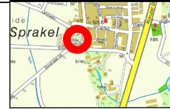
Bestandsplan ohne Maßstab