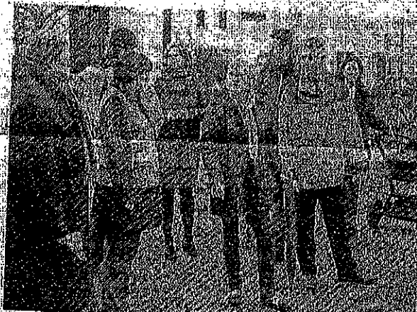
Vertreter von Politik und Verwaltung trafen sich mit Anwohnern der Dyckburgstraße zum Ortstermin.

SÜDMÜHLE Sie sind mit Ihren Familien ins Grüne gezogen, haben absichtlich auf städtische Infrastruktur verzichtet und fühlen sich trotzdem wie Anwohner einer Ringstraße – das sagen die neu nach Südmühle gezogenen Bewohner des kleinen Baugebiets auf dem ehemaligen Beaufays-Gelände. Das Problem: Eine nahe Bahnschranke sorgt für lange Rückstaus. Autofahrer weichen regelmäßig auf die Anliegerstraße aus, um die Schranke zu umfahren.