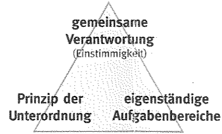
Führungsdreieck nach biblischem Vorbild