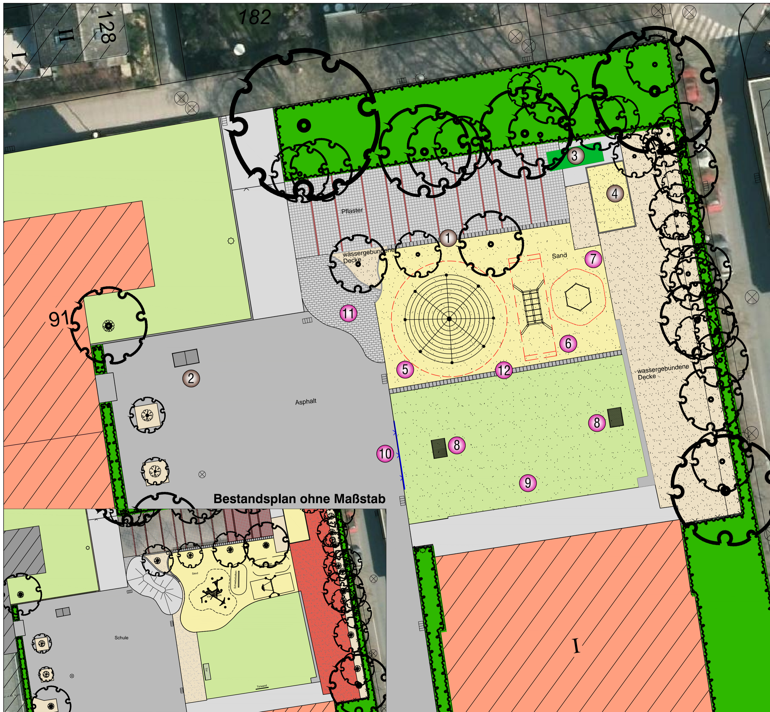
Bestandsplan ohne Maßstab