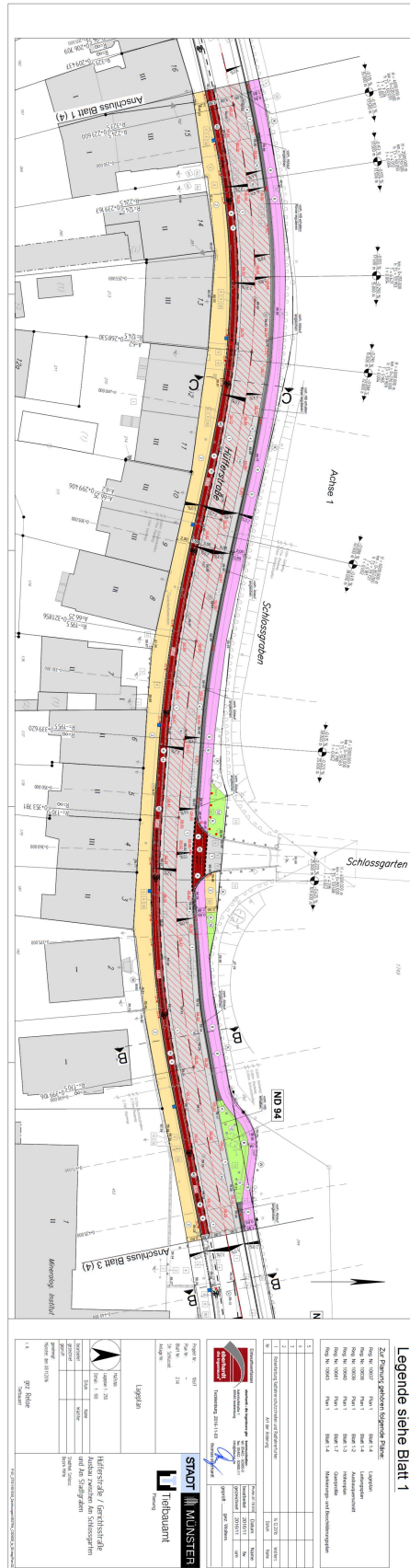
Legende siehe Blatt 1