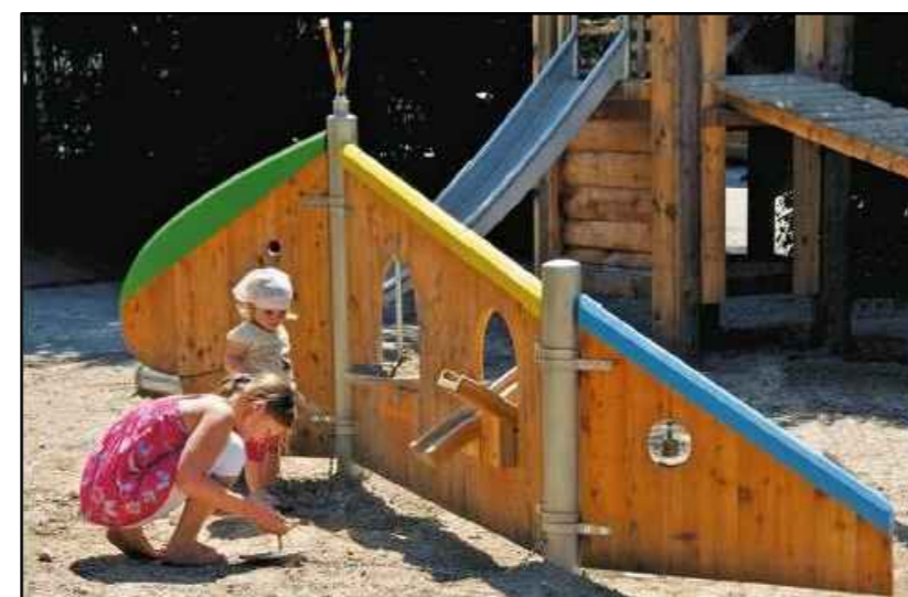
1) Spielgerät "Raupe"