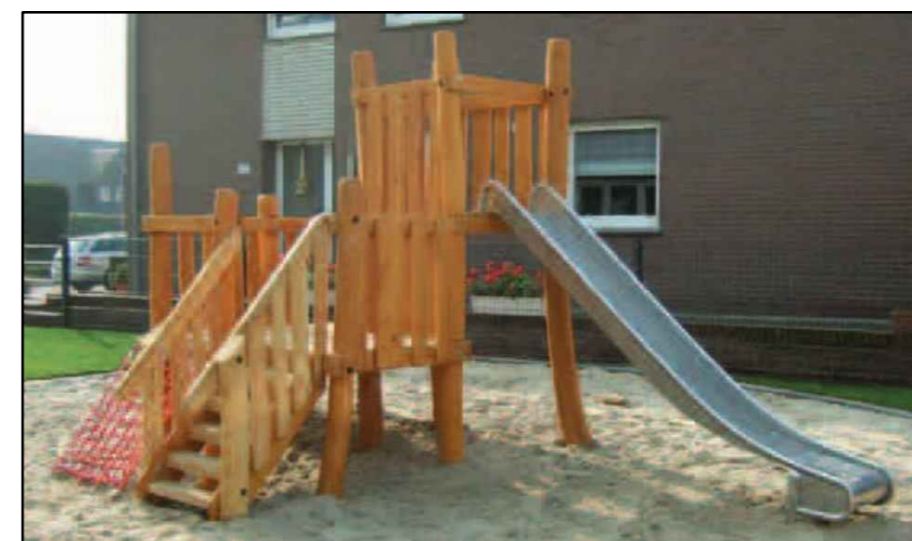
5) Spielgerät "Wilde Wiese"