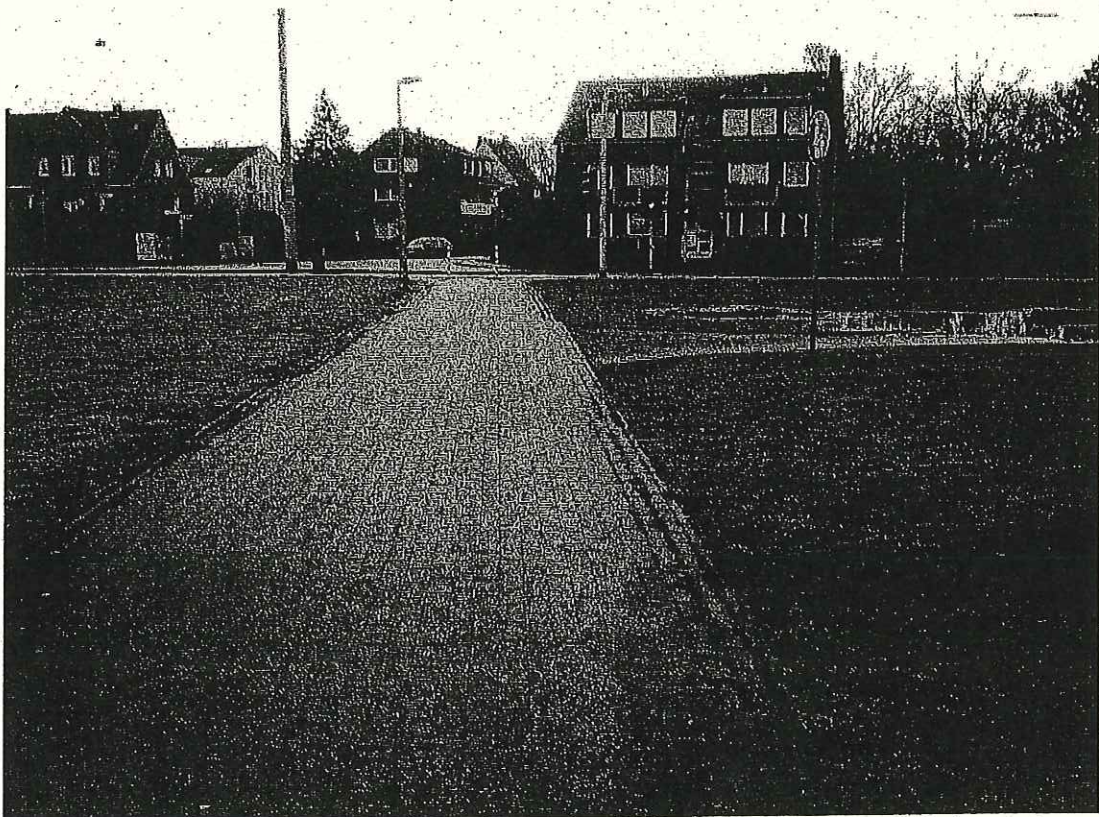
Blick vom Gewerbegebiet Loddenheide auf die mögliche Streckenführung