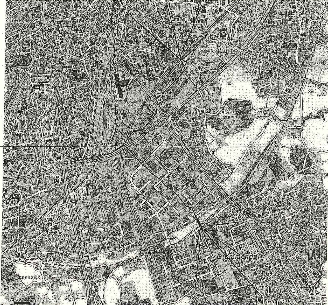
Übersichtskarte: Neue Wegebeziehungen im Bereich Loddenheide