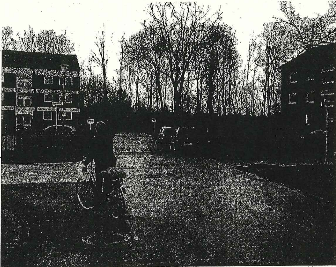
Ansicht vom Biederlackweg