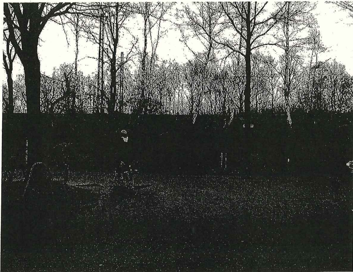
Ansicht vom Heeremansweg Ecke Münnichweg