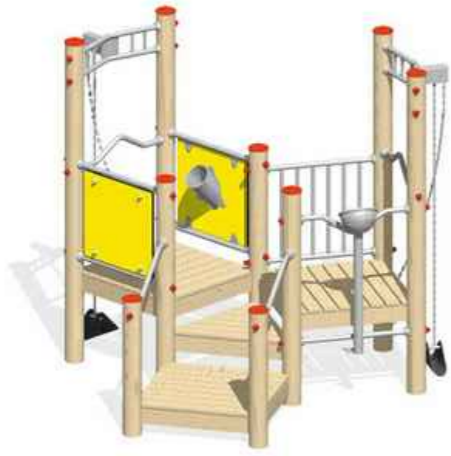
Sandwerk für Kinder ab 2 Jahren