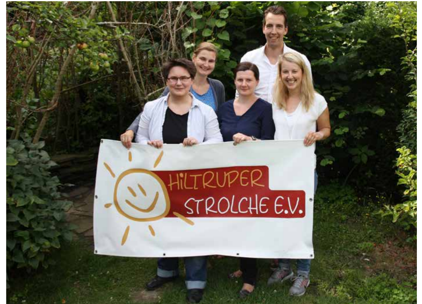
VON LINKS NACH RECHTS