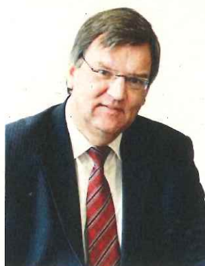
Markus Lewe Oberbürgermeister

falt der wirtschaftlichen Betätigung der Stadt Münster.