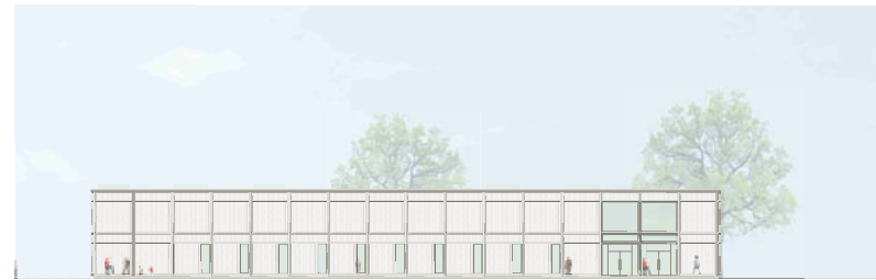
Ansicht Nord 1:200