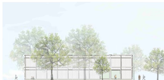
Ansicht West 1:200