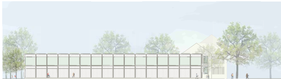
Ansicht Süd 1:200