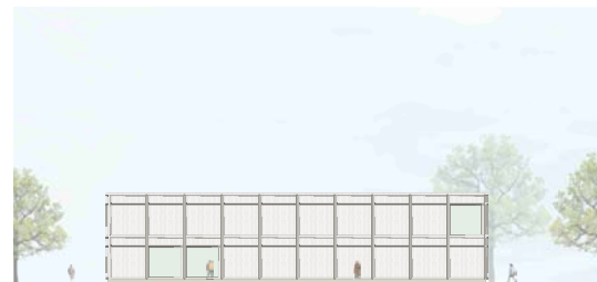
Ansicht Ost 1:200