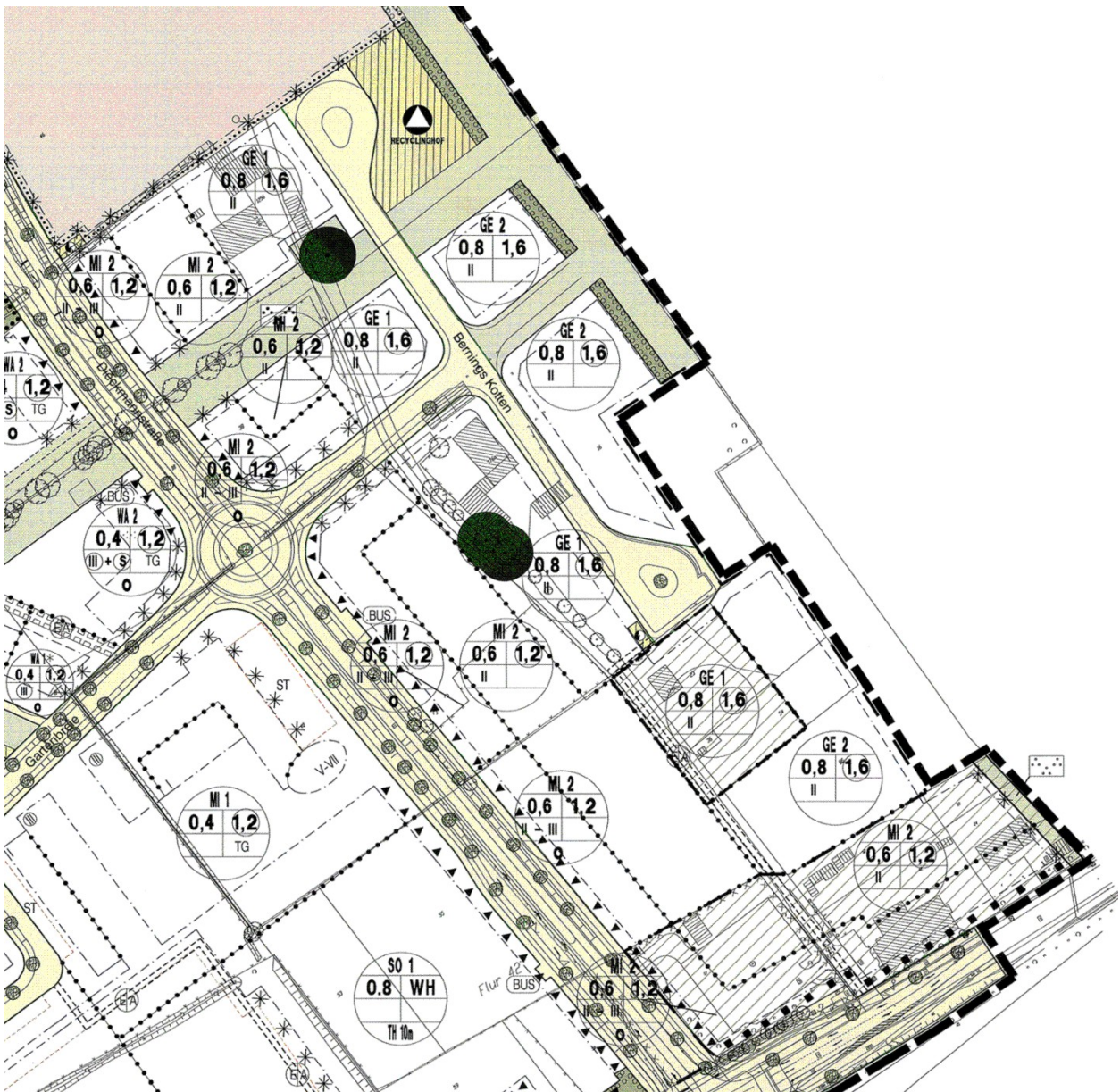
Abbildung 2: Ausschnitt aus dem Bebauungsplan Nr. 441 „Gievenbeck – Ramertsweg / Dieckmannstraße / Roxeler Straße“