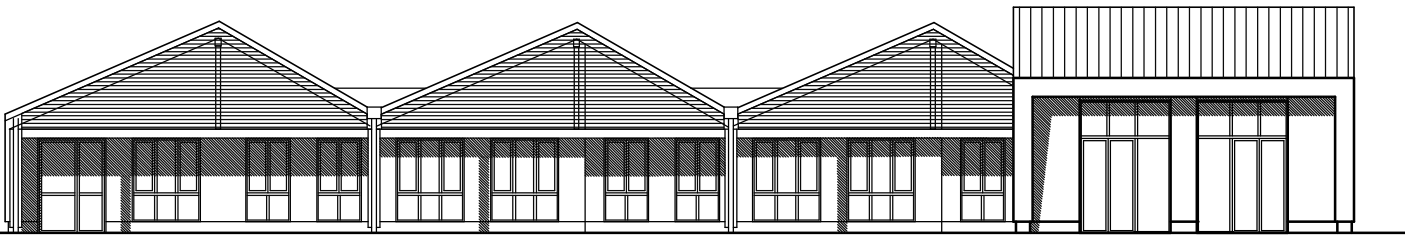
ANSICHT SÜD (vom Garten)