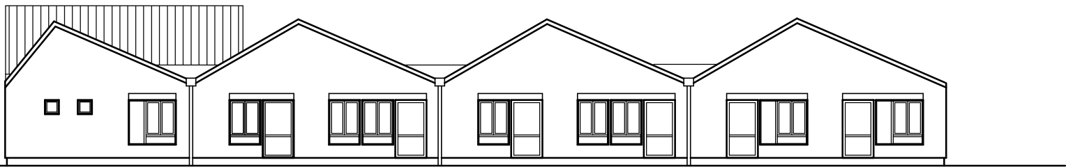
ANSICHT NORD (vom Weg)