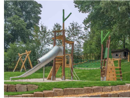
Spielanlage Wildpark Neuhaus, Robinie/Eiche