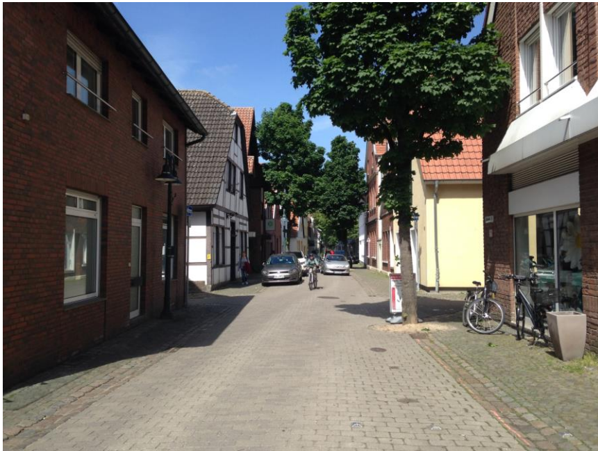
Anlage 2 zur Vorlage V/0439/2018