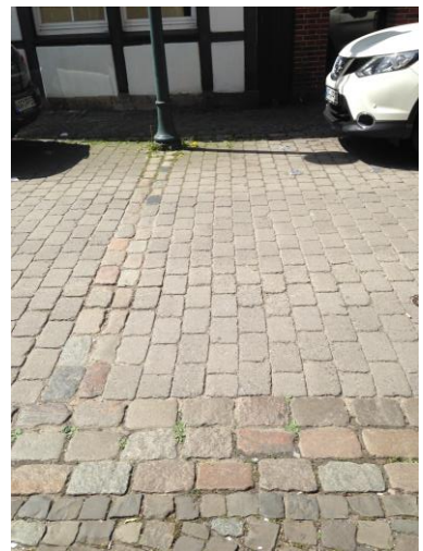
Beispiel Telgte Straßenquerschnitt mit ähnlichen Gebäudeabständen wie im Bereich Lasthaus