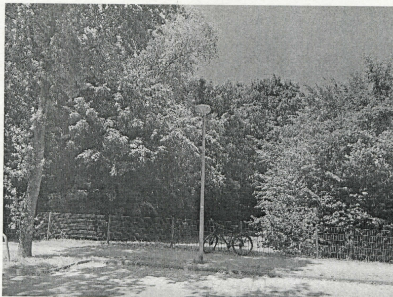
Blick von Süden (Rückertstraße)