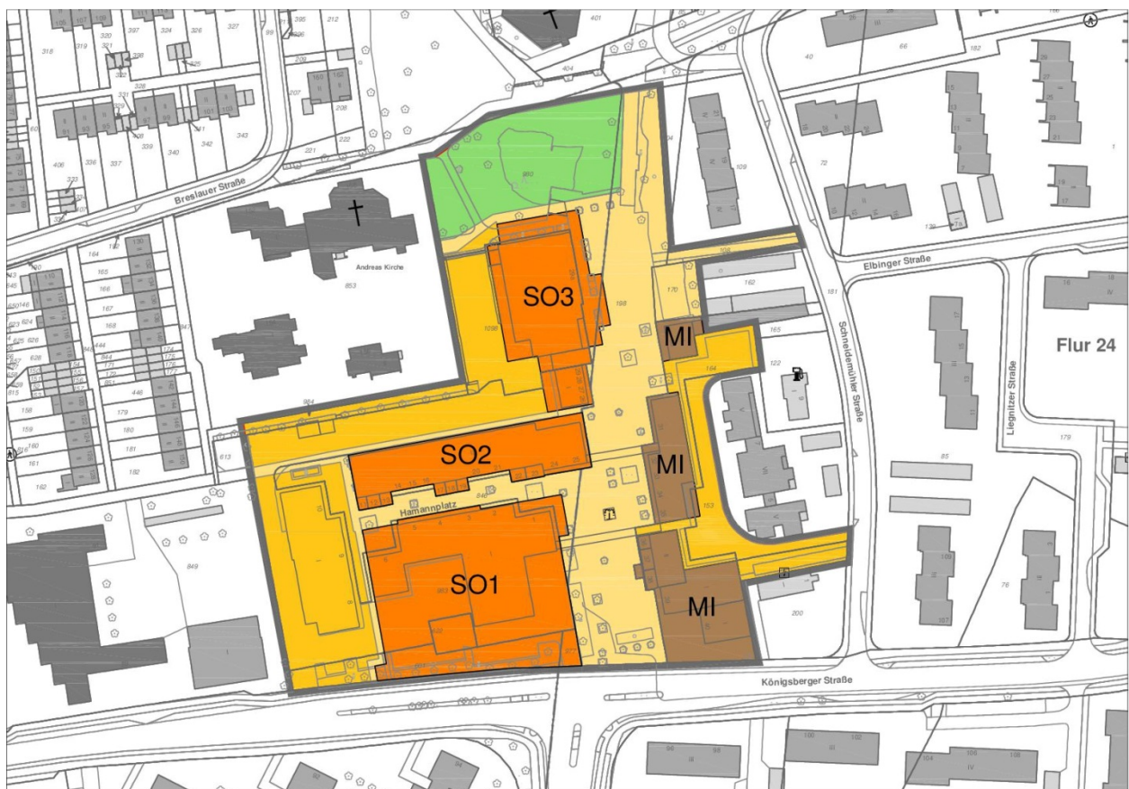
Abbildung 2: Art der Nutzungen im Plangebiet

Neben der strukturell notwendigen und nutzungsfokussierten Erweiterung im Bereich Lebensmittel wird durch zusätzliche Erweiterungsmöglichkeiten eine Aufwertung des Stadtteilzentrums in Coerde erreicht.