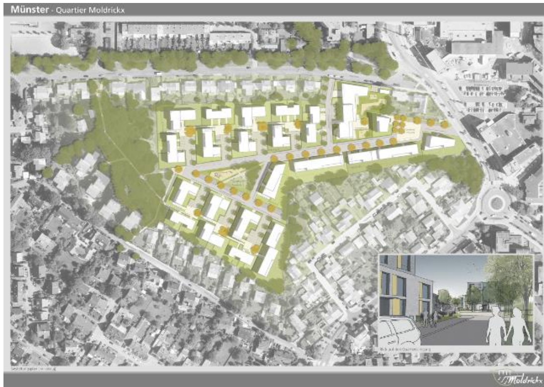
Siegerentwurf des Büros „stadtraum“ Architektengruppe

Die Entwicklung des Quartiers Moldrickx war auch Gegenstand einer intensiven Diskussion im Rahmen des 2017 durchgeführten Workshops zur Selbstevaluation „10 Jahre Soziale Stadt – Maßnahmenprogramm Kinderhaus Brüningheide“, 30.11.2017 (siehe Ergebnisniederschrift vom 24.01.18, Anlage 4). Nach erfolgter Vorstellung und Erläuterung des Siegerentwurfs der Architektengruppe „stadtraum“ aus dem Jahr 2016, wurde in der anschließenden Diskussion insbesondere thematisiert, inwieweit das geplante Quartier ein Entlastungsstandort für den angespannten Wohnungsmarkt in der „Schleife“ sein kann und welche Chance die Bewohnerinnen und Bewohner der Brüningheide, insbesondere Familien, haben, dort Wohnraum zu finden. Auch wurde besprochen, dass die neue Kita im Quartier Moldrickx ein Anknüpfungspunkt für Familien aus der Brüningheide werden könnte, vorausgesetzt, es werde eine Durchlässigkeit und funktionale Verknüpfung über die Wegführung hergestellt.