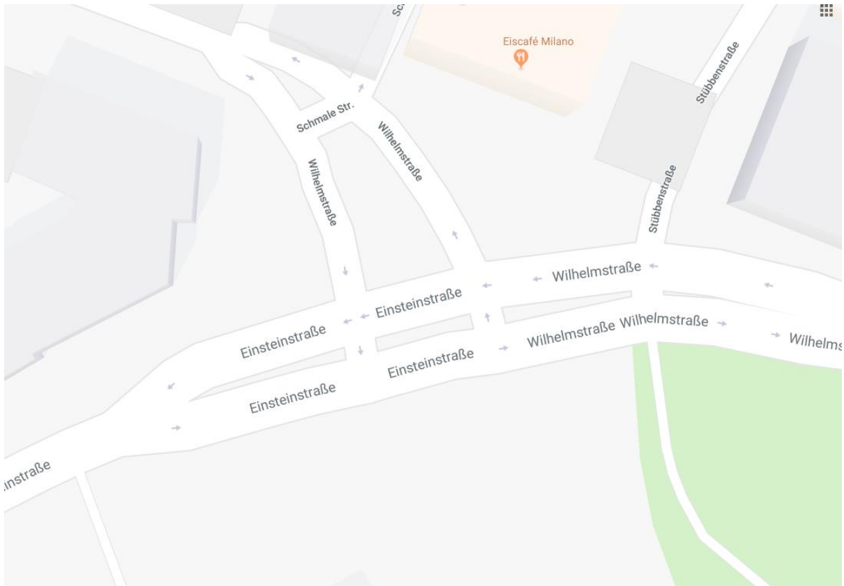
Abb. 1: Östlicher Anschluss