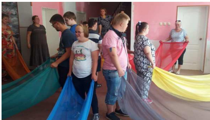
Workshop mit „Zukunftsnavigator“

Voller Begeisterung kehrten die beiden Jugendlichen mit Down Syndrom der Papst-Johannes-Schule Münster mit ihren Müttern und ihrer Lehrerin im August aus Rjasan zurück. Gemeinsam mit dem Förderverein Münster-Rjasan e.V. und der Künstlervereinigung pArt 96 e.V. führten sie das Malprojekt, das 2017 seine Premiere in Münster hatte, fort. Sie malten gemeinsam, lernten die Schönheiten Rjasans und der Umgebung kennen und tauschten sich mit den Rjasaner Kooperationspartnern, insbesondere der Fachstelle „Zukunftsnavigator“, aus.