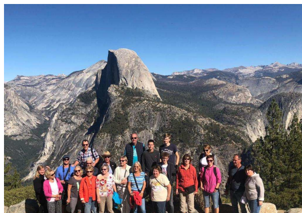
Yosemite National Park

„California – here we come!“ hieß es für die 23 Teilnehmenden der Bürgerreise des Partnerschaftsvereins Münster-Fresno e. V. nach Kalifornien, die vom 13. – 28. Oktober 2018 stattfand. Besondere Tage erlebten die Reisenden bei dem Besuch der Partnerstadt Fresno. Einige der Gastfamilien aus Fresno werden im Sommer 2019 zum Gegenbesuch nach Münster aufbrechen.