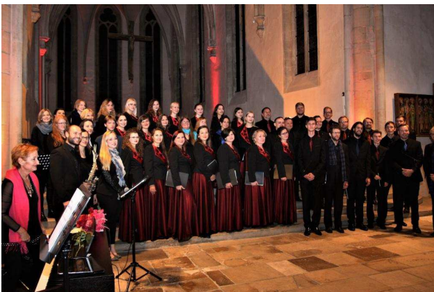
Internationale Nacht der Chöre in der Apostelkirche

Im Rahmen des Münster Vocal Festivals 2018 , organisiert von der Künstleragentur „Leading Voices“, dem Fantast Artist Institut und der Musikhochschule Münster, fand am 27. September die erste Internationale Nacht der Chöre in Münster statt. Teilgenommen haben der „Tonfarbenchor“ der WWU Münster gemeinsam mit dem Chor der Polytechnischen Hochschule aus Lublin. Der Folklorechor aus Rjasan musste leider kurzfristig absagen, präsentierte sich aber in Form einer Videobotschaft. Aus Münster traten verschiedene Chöre auf: Junger Chor Münster, Chor and more der Musikschule Albachten, Marine-Shanty-Chor Münster und AlienRiders. Dank des Chorfestivals konnten erste Kontakte geknüpft werden und es besteht die Hoffnung, dass diese in den nächsten Jahren ausgebaut werden können. Die Internationale Nacht der Chöre, die zunächst im Festsaal