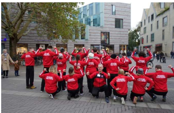
Flashmob in der Stubengasse

Das erste November-Wochenende 2018 stand im Zeichen der Inklusion. Der Tanzsportverein „Die Residenz Münster“ hat gemeinsam mit dem Büro Internationales der Stadt Münster zum internationalen inklusiven Tanzwettbewerb „Europa tanzt inklusiv“ eingeladen. Die inklusive Tanzschule “Academy of Mr. Peter“ aus Lublin hat sehr erfolgreich an dem Tanzwettbewerb teilgenommen. In der Kategorie „A-Finale Combi“ belegten die Lubliner die ersten drei Plätze! Außerdem standen auf dem Programm ein Flashmob in der Stubengasse und ein Workshop.