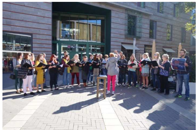
Auftritt des Lubliner Chores in der Stubengasse