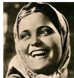
„Die Frauen von Rjasan“

Die 11. Russischen Filmtage Münster finden vom 10. – 31. März im Schlosstheater statt. Es werden fünf aktuelle russische Autorenfilme gezeigt, ausgewählt aus den Preisträgern internationaler Filmfestivals. Anlässlich des Städtepartnerschaftsjubiläums wird zur Eröffnung am 10. März, 17:00 Uhr ein Stummfilmklassiker „ Die Frauen von Rjasan “ aus dem Jahr 1927 gezeigt. Weitere Infos unter: http://drg-muenster.org/