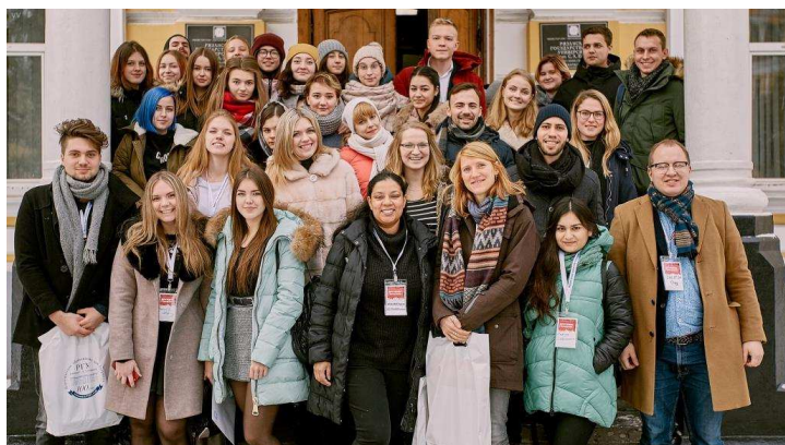
Ein warmer Empfang an der Uni Rjasan trotz der Minustemperaturen

Einen spannenden Aufenthalt haben acht Studierende der WWU Münster sowie eine Vertreterin der FreiwilligenAgentur Münster hinter sich. Ende November 2018 reisten sie zum 1. Jugendaustausch „ Let us be friends “ nach Rjasan. Das Projekt wurde von der Staatlichen Jessenin-Universität