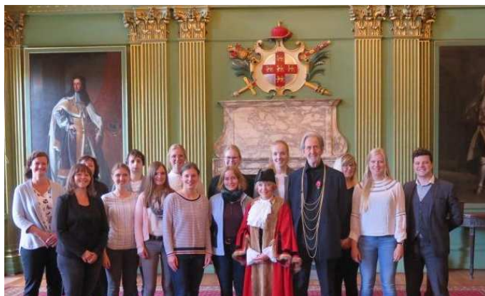
Empfang beim Sheriff im Mansion House

Trotz des drohenden Brexit ging das vom Personal- und Organisationsamt und Büro Internationales im Amt für Bürger- und Ratservice gemeinsam entwickelte Projekt zur beruflichen Bildung erfolgreich in die fünfte Runde. Zehn Auszubildende sowie zwei Ausbilderinnen der Stadt Münster hatten vom 27. Oktober – 10. November 2018 die Gelegenheit, einen Einblick in die Arbeitswelt der britischen Partnerstadt zu erhalten. Es folgten Hospitationen bei der Stadtverwaltung York und in anderen Betrieben sowie einwöchiger Englisch-Sprachkurs bei dem Institut „ York Associates “. Im Februar machte sich schon die nächste Gruppe bereit. Mit dem von ERASMUS+ noch bis Ende 2019 geförderten Projekt möchte sich die Stadt Münster fit machen für internationale Kontakte. Ob das Projekt nach dem Brexit weiterbestehen kann, wird sich zeigen.