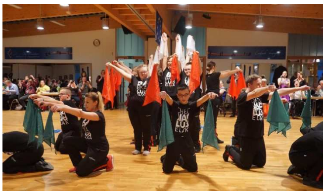
Der große Auftritt von “Academy of Mr. Peter“