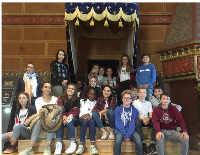
Pascal-Gymnasium im Château de Blois

Im Oktober zu Beginn des Schuljahres 2018/19 brach eine Gruppe von Schülerinnen und Schülern des Pascal-Gymnasium für acht Tage nach Orléans auf. Einen Rückbesuch in Münster erwarten