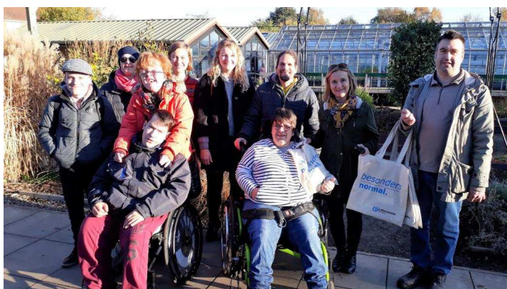
In der Gartenanlage des Brunswick Social Club

Eine weitere Begegnung in York fand Ende Oktober zwischen der Lebenshilfe Münster und dem Brunswick Social Club statt. Auf dem Hof des Brunswick Social Clubs arbeiten Menschen mit