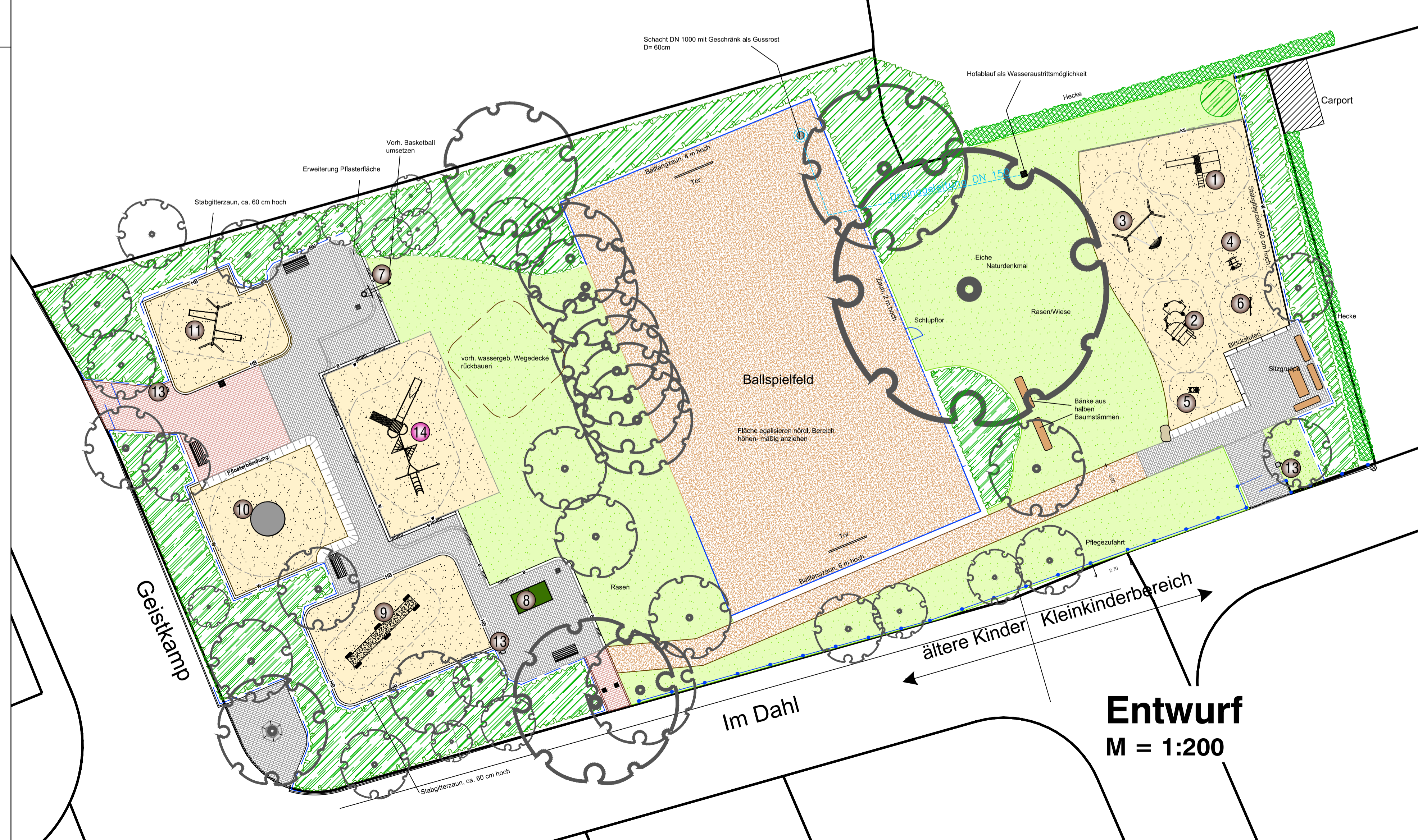
Entwurf M = 1:200