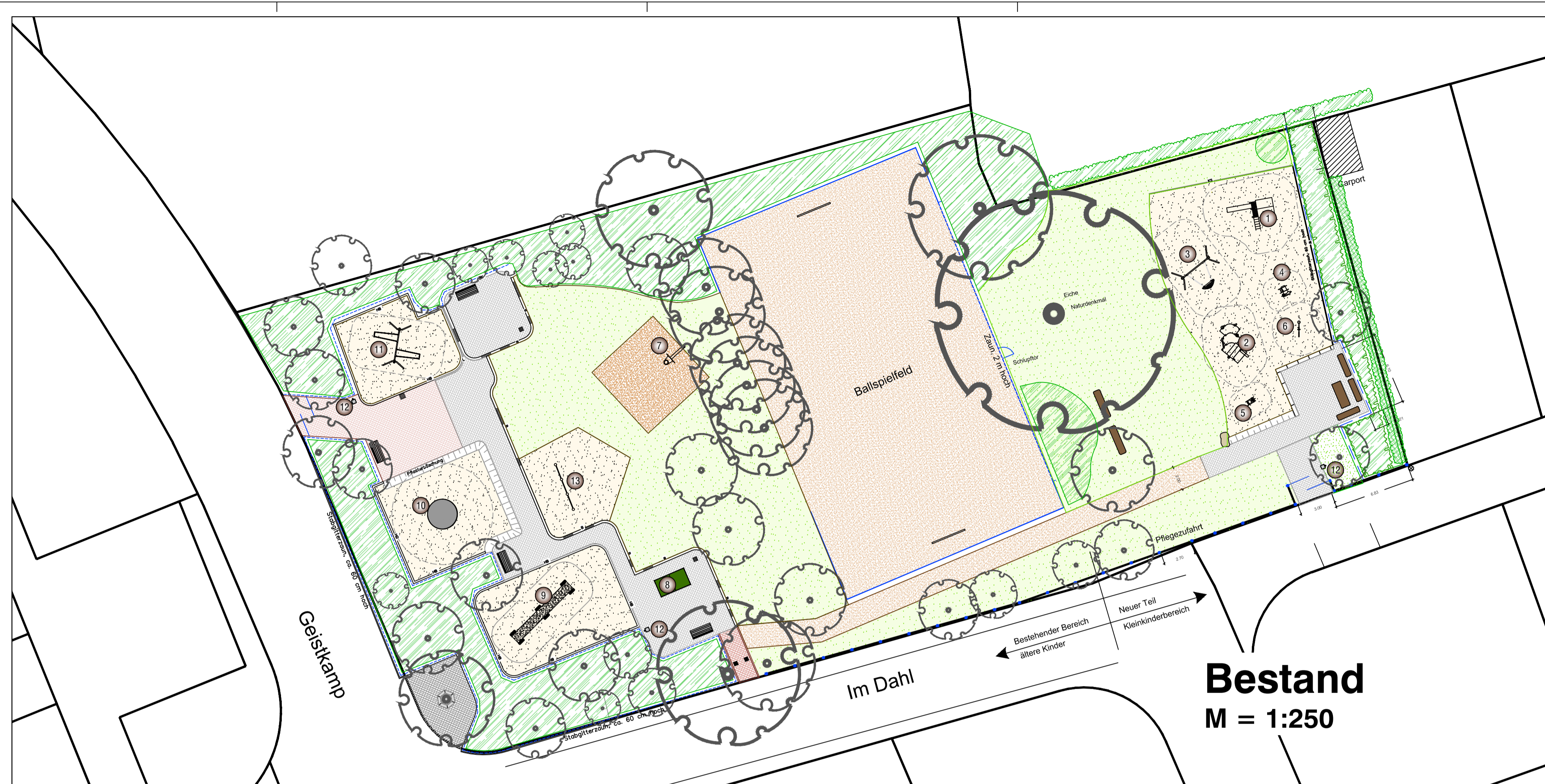
Bestand M = 1:250