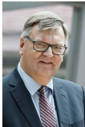
Markus Lewe Oberbürgermeister

Ferner sorgt das Beteiligungsmanagement für eine Verbindung zwischen den städtischen Einrichtungen und Unternehmen, dem Rat und der Verwaltung. Die Umstellung vom Instrument einer „Beteiligungsverwaltung“ zu den modernen Techniken des „Beteiligungsmanagements“ hat sich langfristig bewährt und gefestigt.