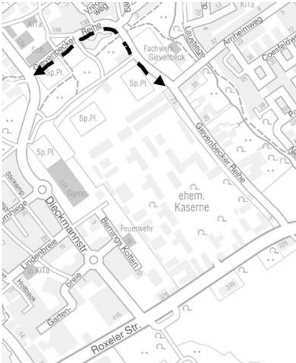
Abb 2.: Vorhandene Wegebeleuchtung

Im Zuge des Ausbaues und Umgestaltung der Oxfordkaserne wird eine zusätzliche beleuchtete Wegeverbindung zwischen „Bernings Kotten“ und „Arnheimweg“ geschaffen (siehe Abb. 3) und damit die Verbindung zwischen dem Auenviertel und dem Zentrum von Gievenbeck verbessert.