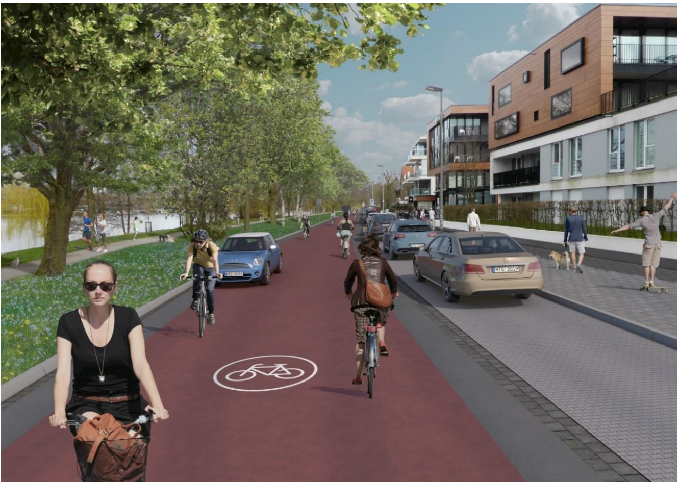
Abb. 5: Visualisierung der Fahrradstraße Bismarckallee

Für den Radverkehr ergeben sich durch den „Flyover Aegidiitor“ deutliche Fahrzeit- und Komfortgewinne, denn das Aegidiitor ist gleichzeitig Ausgangs- bzw. Endpunkt der beiden Velorouten zwischen Münster und Senden (a: via Albachten und b: via Hansa-Business-Park). So könnte durch den „Fly-over Aegidiitor“ gleichsam ein neuralgischer Zwangspunkt der Veloroutenkonzeption visionär gestaltet und eine zügige Radverkehrsanbindung u.a. in die neu gestaltete Fahrradstraße Bismarckallee (vgl. Abb. 5) ermöglicht werden.