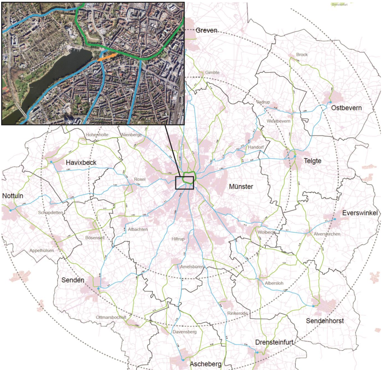
Abb. 6: Velorouten in der Stadtregion

Zur Einordnung: Die Promenade wird künftig als Ausgangs- bzw. Endpunkt integraler Bestandteil des regionalen Veloroutennetzes (14 Alltags-Pendler-Routen, quasi „Radschnellwege light“) (vgl. Abb. 6) sein, das Münsters Innenstadt mit den Außenstadtteilen und den Umlandgemeinden zügig, durchgängig und komfortabel verbinden wird. Der aktuelle Sachstand bezüglich der Velorouten lässt sich folgendermaßen zusammenfassen: Für die Route Münster-Telgte läuft bereits die Ausführungsplanung, erste baulich Umsetzungen werden noch in 2020 realisiert. Sieben weitere Velorouten nach Senden, Nottuln, Greven, Ascheberg, Drensteinfurt, Altenberge und Everswinkel befinden sich derzeit in den ersten Planungsphasen (Variantenuntersuchungen, Vorplanungen). Für die sechs übrigen Routen (u.a. Ostbevern, Havixbeck, etc.) werden noch in 2020 Ingenieurleistungen beauftragt.