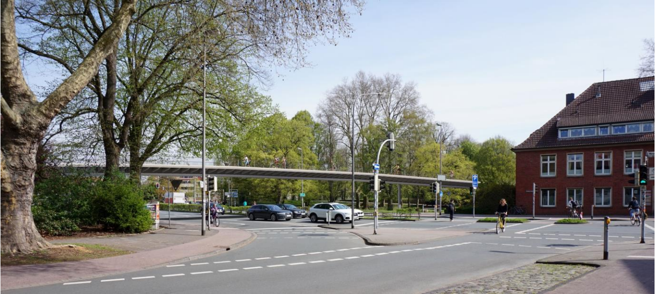
Abb. 4: Visualisierung „Flyover Aegidiitor“ (3)