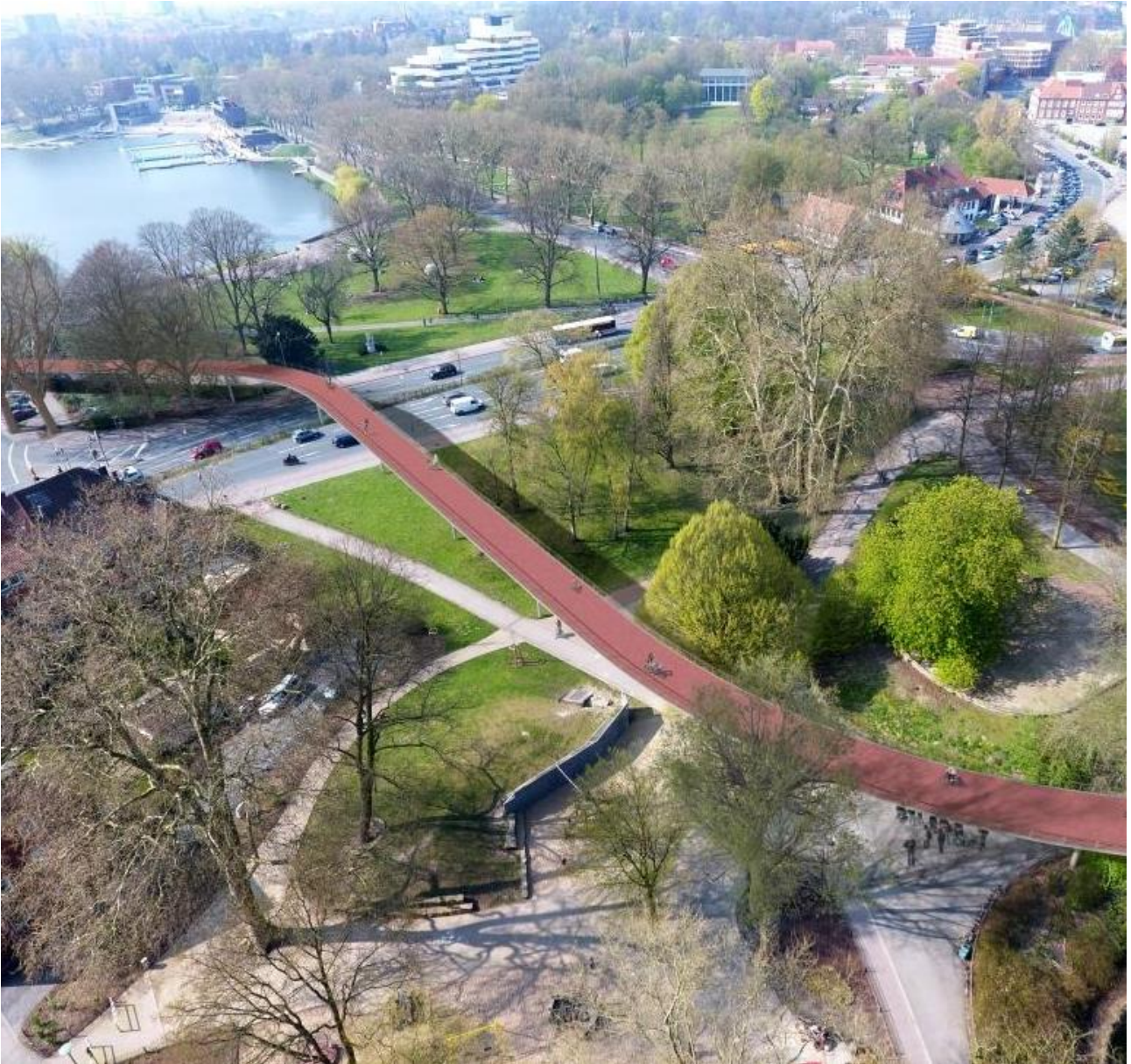
Abb. 2: Visualisierung „Flyover Aegidiitor“ (1)