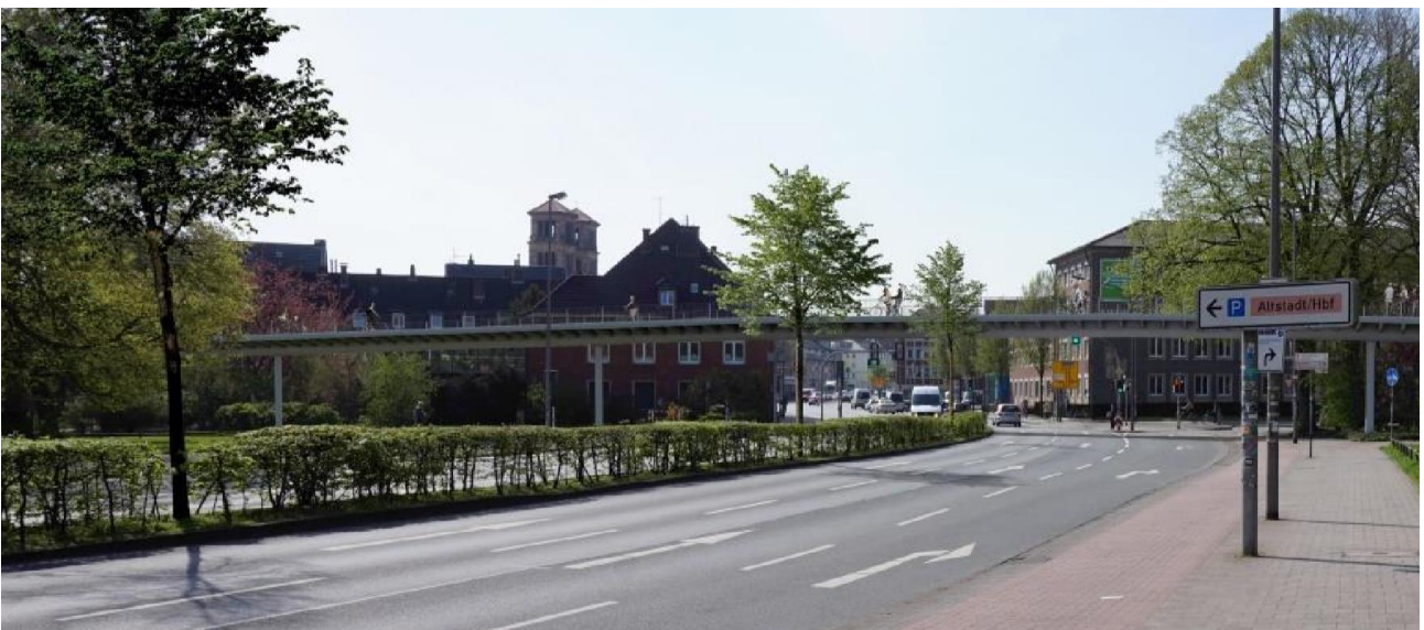
Abb. 3: Visualisierung „Flyover Aegidiitor“ (2)