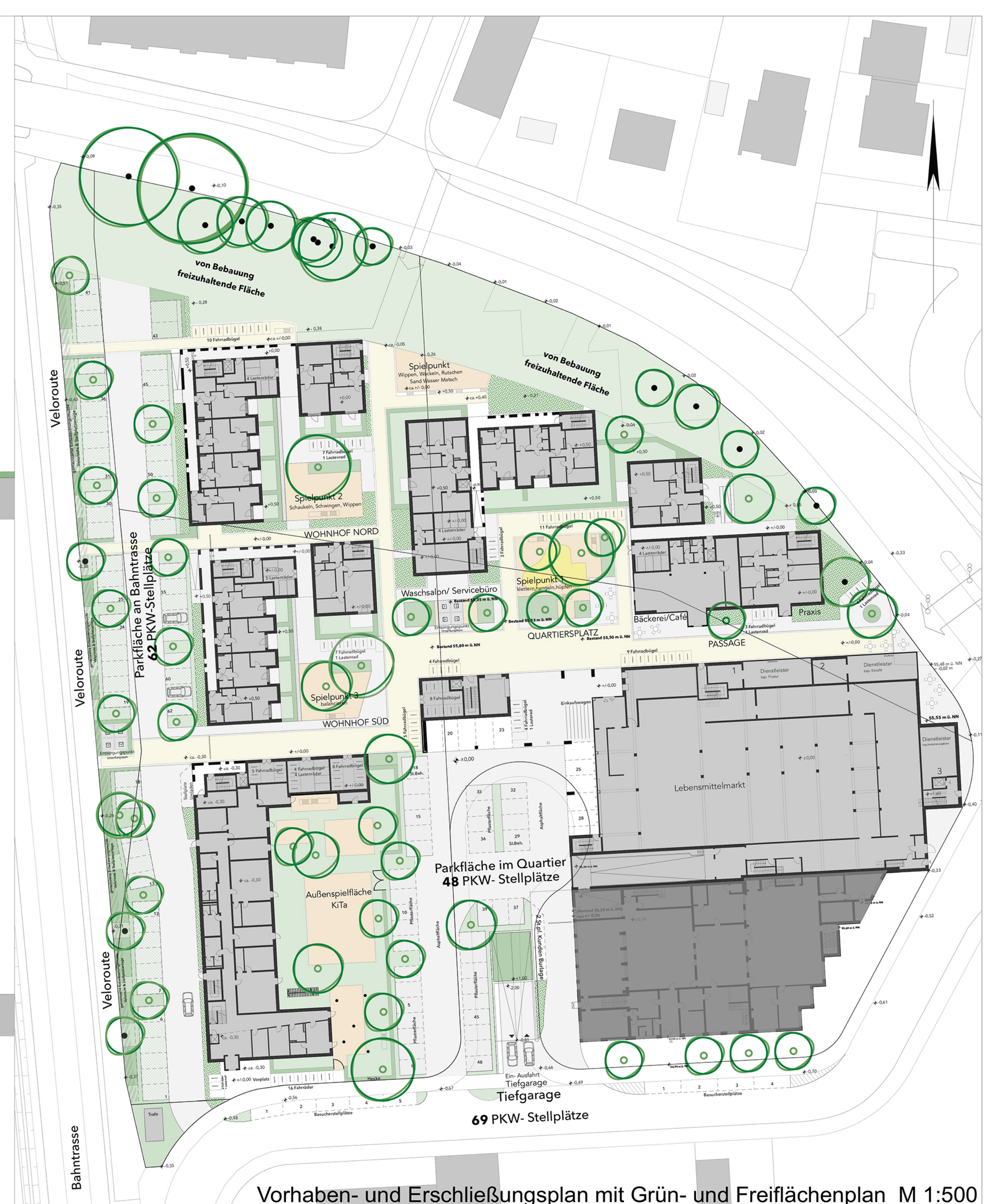
Vorhaben- und Erschließungsplan mit Grün- und Freiflächenplan M 1:500