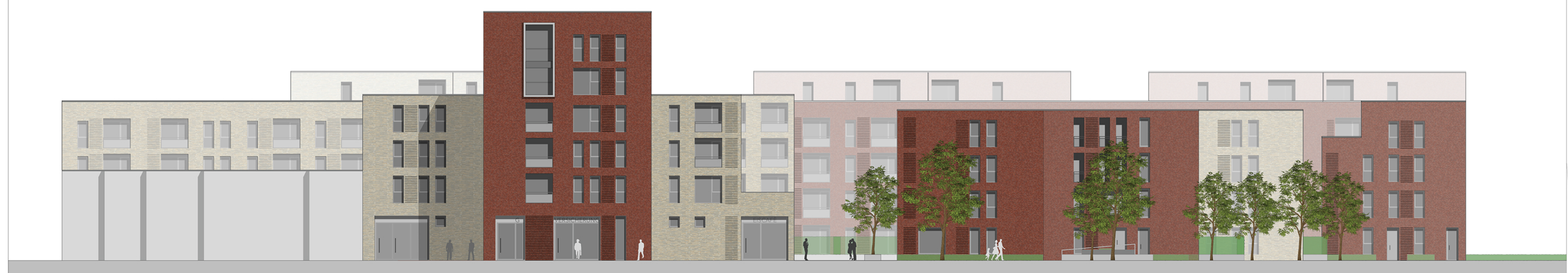
Kiesekampweg Druckerel Burlage Passage Holtmannsweg