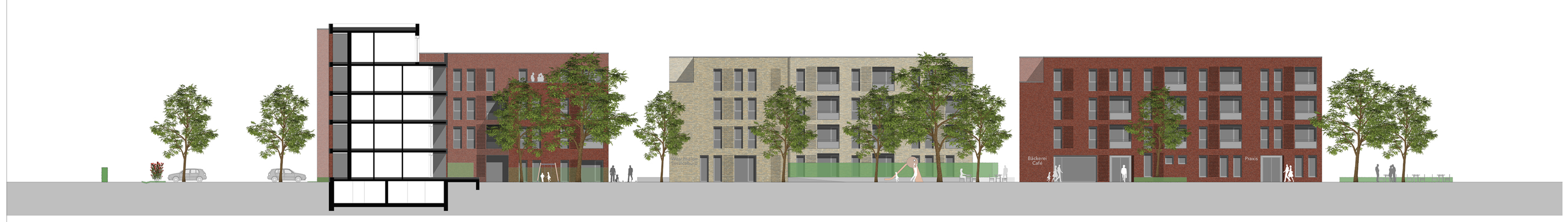
Ansicht von Süden / Schnitt durch die Passage