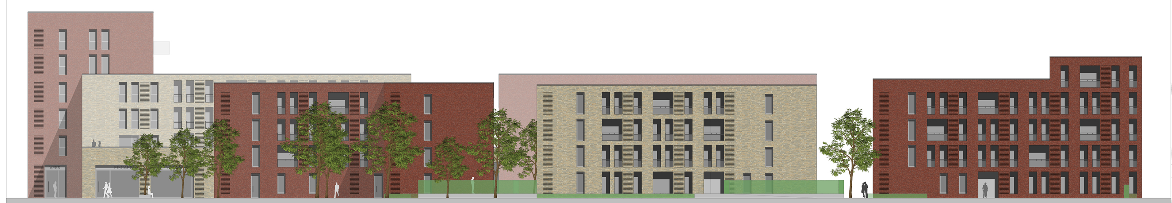
Ansicht von Norden (Holtmannsweg)