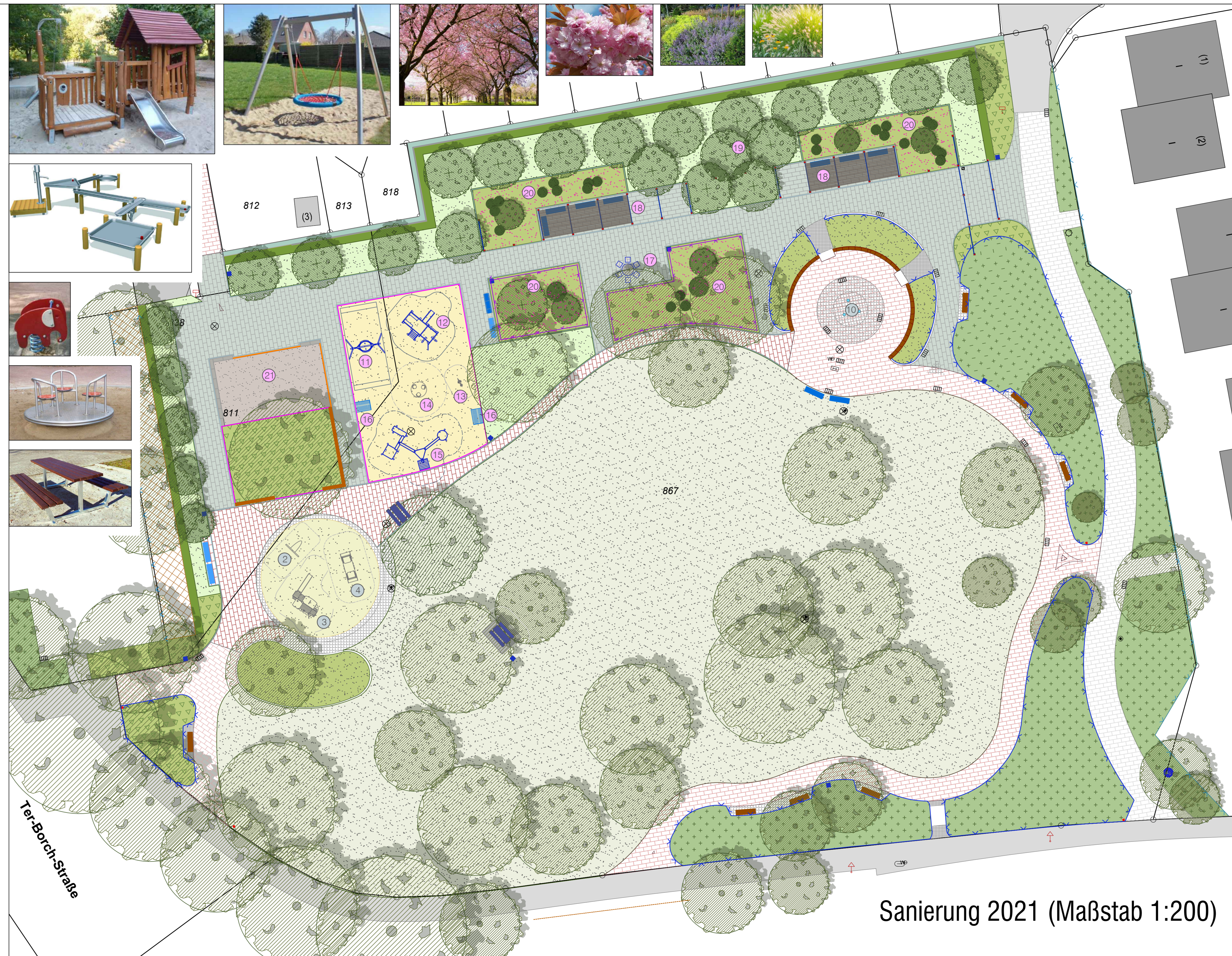
Sanierung 2021 (Maßstab 1:200)