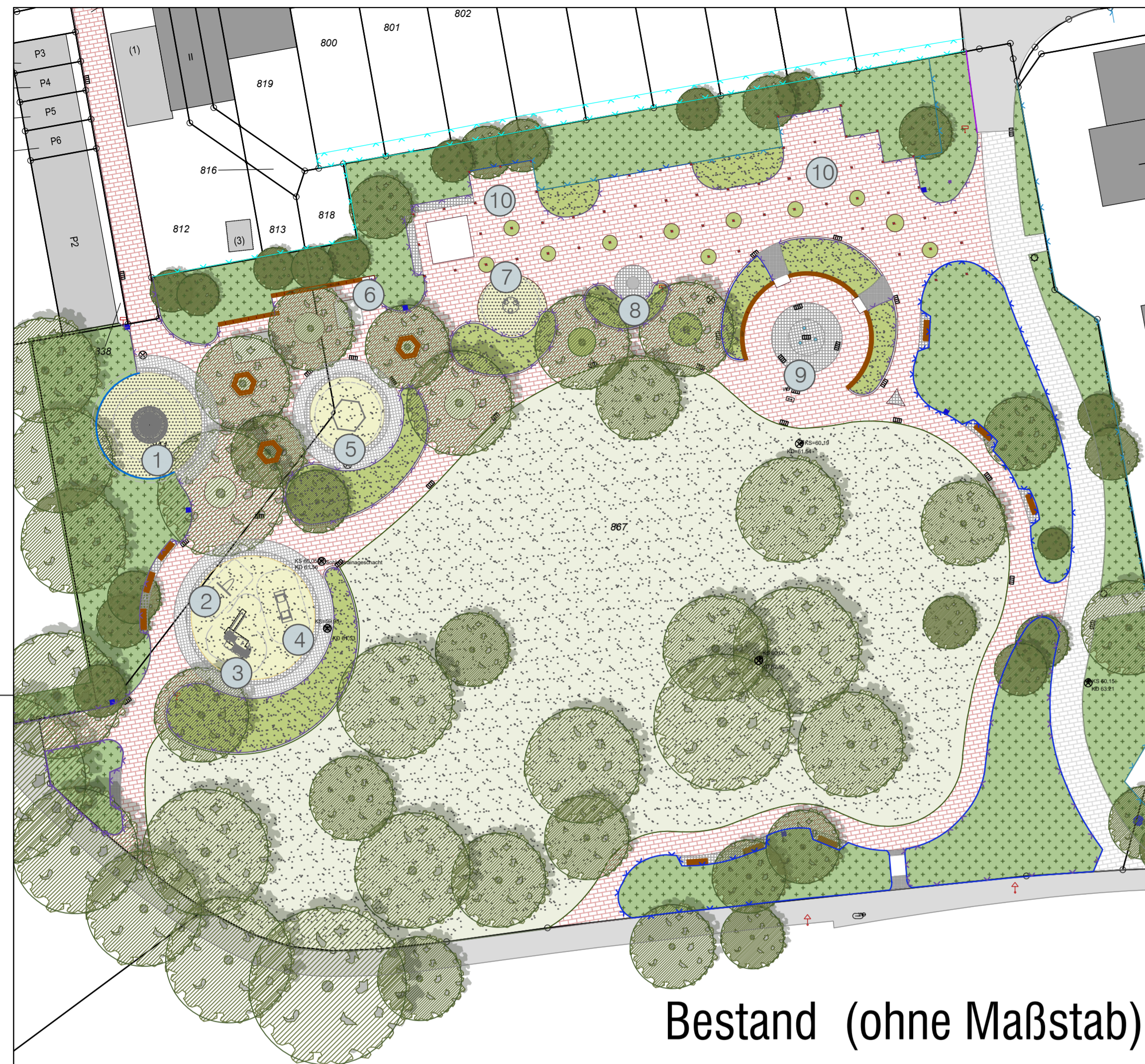
Bestand (ohne Maßstab)