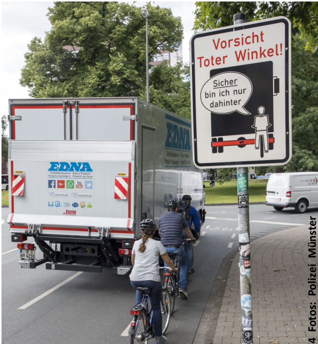
4 Fotos: Polizei Münster

Transfer des Gelernten in den Alltag durch gemeinsame Pedelec-Ausfahrt und Gefahreneinschätzungen an ausgewählten Örtlichkeiten im Stadtgebiet Münster.