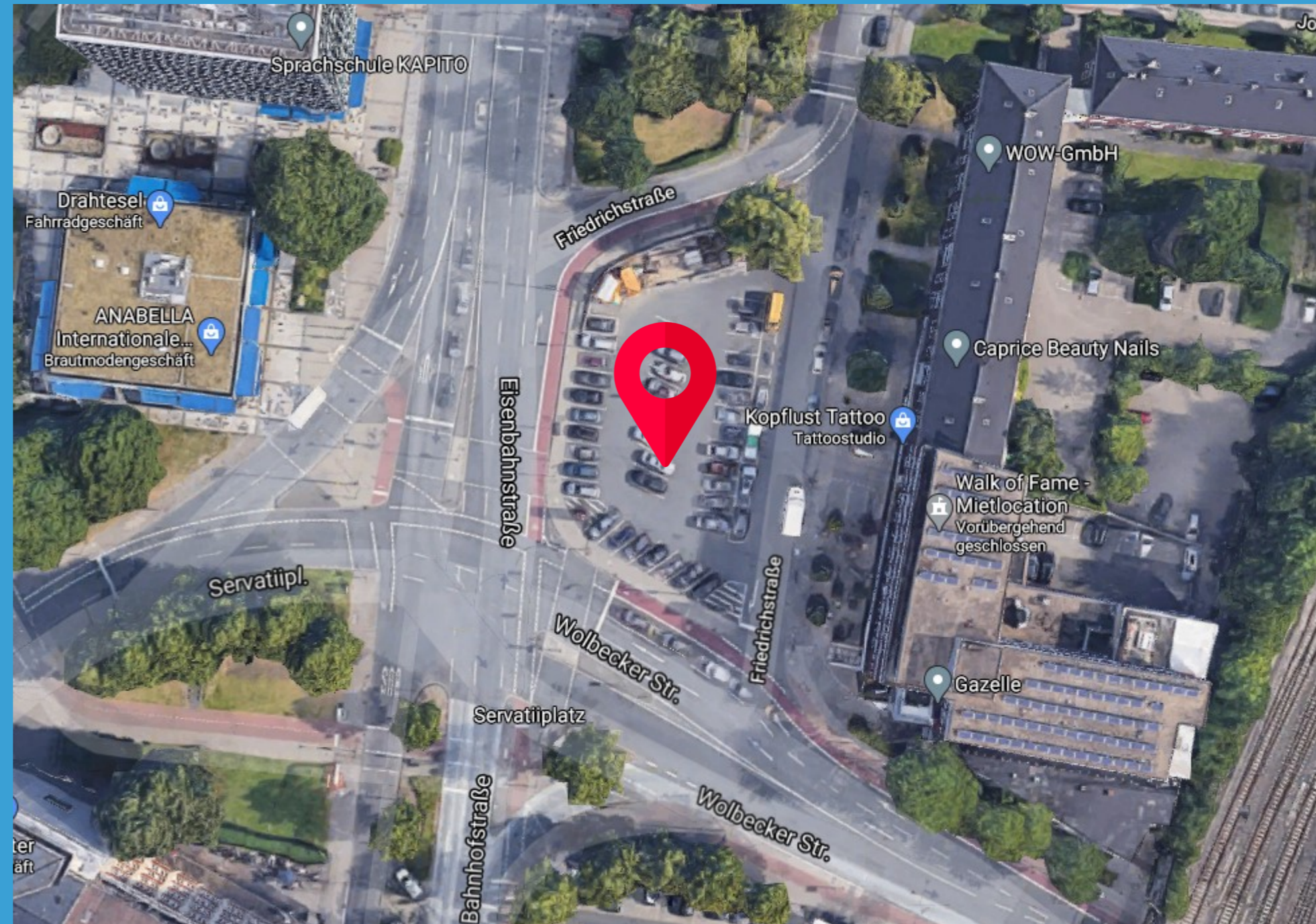
Bild: Die Standortanzeige wurde unter Verwendung von Ressourcen von Flaticon.com erstellt.