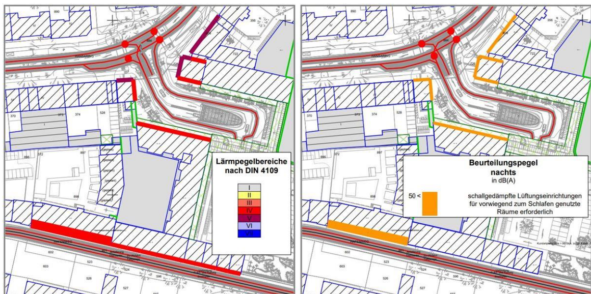
Abbildung 1 | Gebäudelärmkarten Verkehrslärm (Maximalsituation). Links: Darstellung der Lärmpegelbereiche (LPB) gemäß DIN 4109 (Angabe des höchsten LPB je Fassade). Rechts: Darstellung der Bereiche für zusätzliche textliche Festsetzungen zur Lärmvorsorge (schallgedämpfte Lüftungseinrichtungen für vorwiegend zum Schlafen genutzte Räume) (ZECH Ingenieurgesellschaft mbH Lingen, 08.01.2021 S. 53 und 55; Anlage 4.1 und 4.3 (verändert)).

Verkehrsbelastungen bedingen im Plangebiet Überschreitungen der für Mischgebiete geltenden schalltechnischen Orientierungswerte der DIN 18005 während der Tages- und der Nachtzeit. Betroffen sind die straßenzugewandten Fassaden an Hansaring und Hafenweg sowie zum Teil auch Fassaden mit Ausrichtung zu Anschlussknotenpunkt und Erschließungsstraße (Abbildung 1).