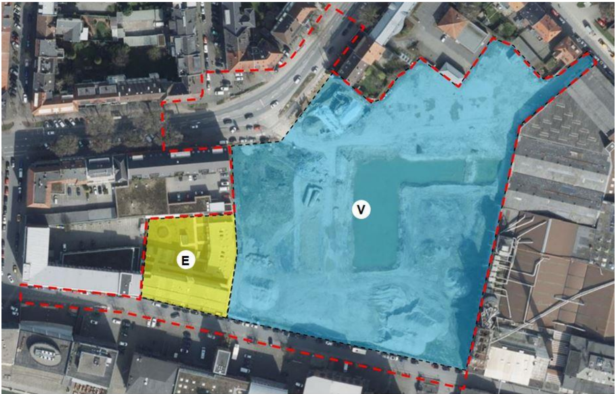
Abbildung 4 | Zustand des Plangebietes im Jahr 2017, d. h. vor Beginn der Bauarbeiten im Vorhabenbereich. Blau = Vorhabenbereich (V), gelb = Ergänzungsbereich (E), rote Grenze = Geltungsbereich des VBP Nr. 609 (Luftbild: Bezirksregierung Köln – TIMonline © Land NRW, ergänzt).

Im Ergebnis bereitet der vorhabenbezogene Bebauungsplan keinen Eingriff in Natur und Landschaft i. S. der naturschutzrechtlichen Eingriffsregelung der §§ 14 und 15 BNatSchG vor, eine Kompensationsberechnung erfolgt daher nicht. Davon unabhängig sind hinsichtlich der grünordnerischen Gestaltung des Gebietes Maßnahmen geplant, über die ein Mindestmaß an grünordnerischer Qualität gesichert wird (Pflanzung von mindestens 30 Bäumen, Dachbegrünung auf einer Fläche von 6.000 m 2 , Anlage des sog. Pocket-Parks am Hafenweg). Über diese Maßnahmen können auch die am Hansaring gerodeten sieben Straßenbäume als ersetzt gelten.