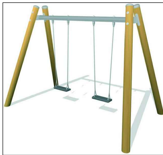
Spielbereich Entdecker: Schaukel Holzfass mit Kletternetz Rutschturm U3