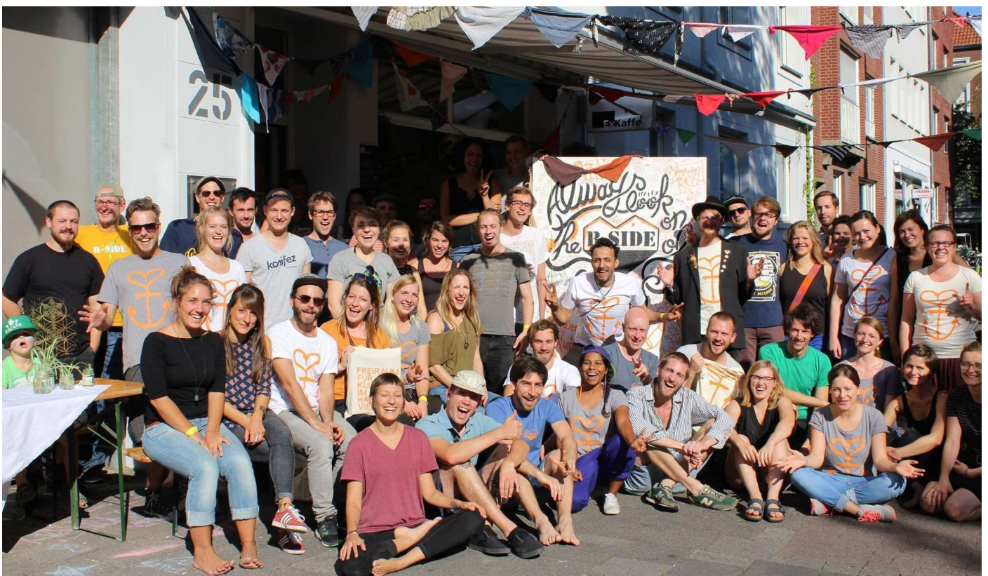
B-Side Festival Team 2016 im Hansaviertel

umliegenden Hansaviertel: In über 20 Lokalisationen erwarteten die mehreren tausend Besucher:innen dabei über 100 Konzerte, Ausstellungen, Workshops und Diskussionen – ein buntes Kultur- und Bildungsprogramm rund um die Themen Musik, Kunst, Kultur, Bildung, Nachhaltigkeit und gemeinnützige Stadtentwicklung. 2020 konnte das Festival erfolgreich unter strikten Hygienebestimmungen veranstaltet werden. Neben der eigenen Radiosendung “B-Side-Funk” und (sub-)kulturellen Konzerten trägt der Verein mit kreativen Beiträgen seit Jahren auch zu lokalen Ereignissen wie den “Wochen gegen Rassismus” oder den “Zukunftsspaziergängen” bei. Während der Corona-Pandemie konnte er außerdem Formate ins Internet verlegen, so beispielsweise schon über zehn Konzert-Livestreams und Workshops im Bereich der kulturellen Bildung. Nach Ende der Corona-Auflagen wird der B-Side Kultur e.V. auch die schon getesteten Formate “Macht x Stadt” (Bildungsworkshops), Faltenrock (soziokulturelle DJ-Konzerte für Ü60-Gäste) und die Konzertveranstaltungen auf der Rampe des Hill-Speichers weiter ausbauen sowie weitere Projekte organisieren.