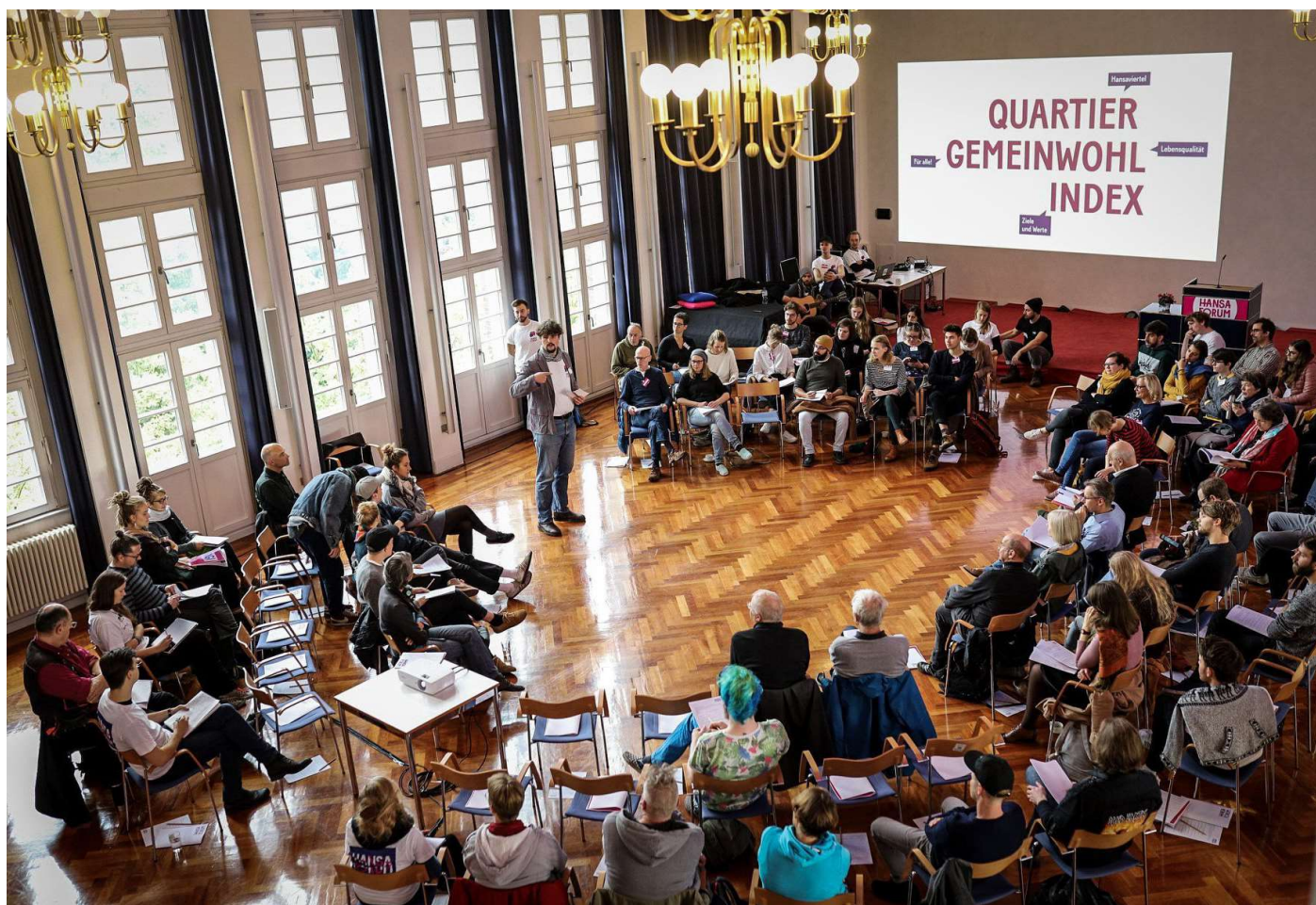
II Hansa-Konvent 2019

und festgelegt. Diese mündeten in den sog. Quartier-Gemeinwohl-Index (QGI), welcher einerseits als eigene Förderrichtlinie für eingereichte Quartiersprojekte dient, vor allem aber auch konstanter Aushandlungsprozess dessen ist, was die Bürger:innen unter Gemeinwohl in ihrem Viertel verstehen. Ob ein Projekt den Werten und Zielen des QGI entspricht und somit förderfähig ist, entscheiden zum einen das Hansa-Gremium (ein aus Verwaltung, Politik, Bürger:innen und B-Side GmbH zusammengesetztes Entscheidungsgremium) und zum anderen die zweimal im Jahr tagenden Hansa-Konvente. Das Hansaforum stellt bis Ende 2021 insgesamt 250.000 Euro zur Verfügung, um gemeinwohlorientierte Projekte aus der Bürgerschaft im Hansaviertel zu fördern: Eine Viertelmillion fürs Viertel.