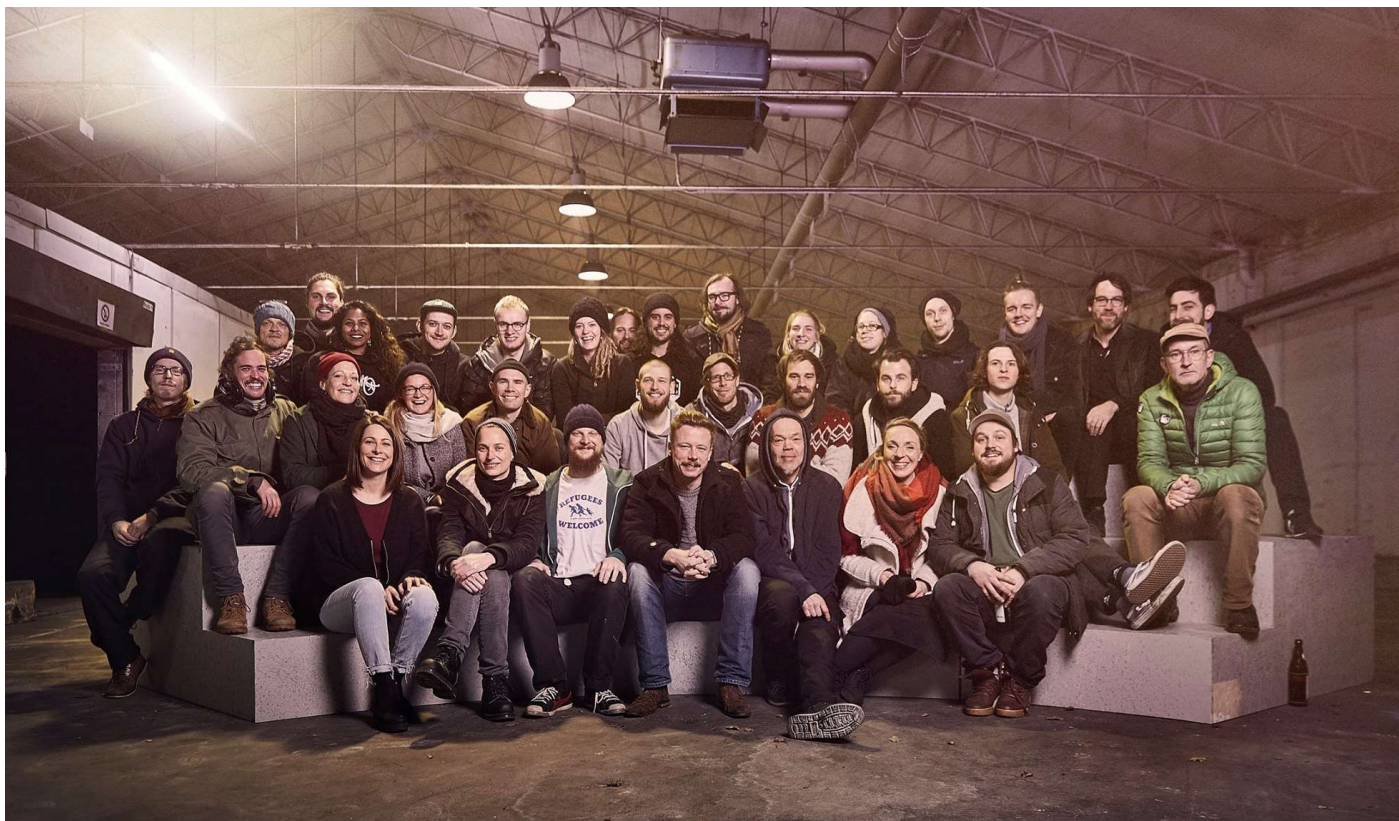
B-Side Kultur e.V. im Hill-Speicher

Das Kollektiv um die B-Side ist davon überzeugt, dass von Offenheit geprägte selbstbestimmte und selbstverwaltete Strukturen Bürger:innen befähigen, einen konstruktiven Beitrag zur Gesellschaft zu leisten. Um maximale Mitbestimmungsmöglichkeiten zu gewährleisten, ist die B-Side daher nach dem soziokratischen Modell organisiert (Soziokratie 3.0) und lädt regelmäßig zur Partizipation an ihrer Standortentwicklung oder ihren Projekten ein.