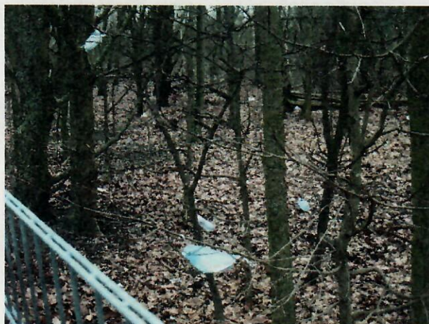
Grünfläche gegenüber dem „Weißen Riesen“