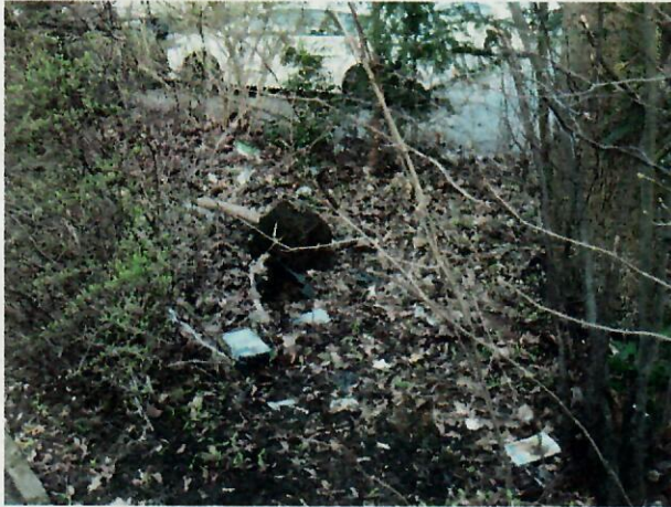
Grünanlage am Haus Simeon