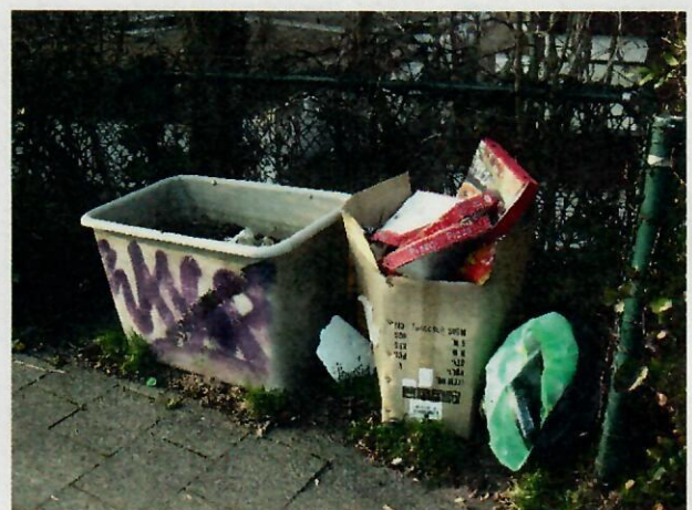
Streumittelbehälter an der Trauttmansdorffstraße

Das Thema Sauberkeit sollte insbesondere auch im Rahmen des integrierten Stadtteilentwicklungs-konzeptes Berg Fidel betrachtet werden. Es ist nach unseren Einschätzungen eines der Themen, welches die Menschen in Berg Fidel in Bezug auf ihren Stadtteil am meisten bewegt. Mehr Sauberkeit würde hier für eine verbesserte Lebensqualität für die Berg Fideler*innen sorgen!