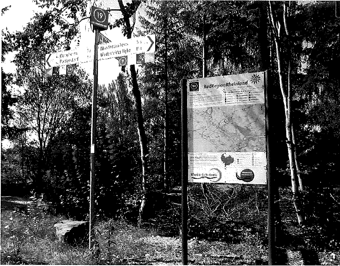
Knotenpunktwegweiser mit Übersichtstafel in der Radregion Rheinland