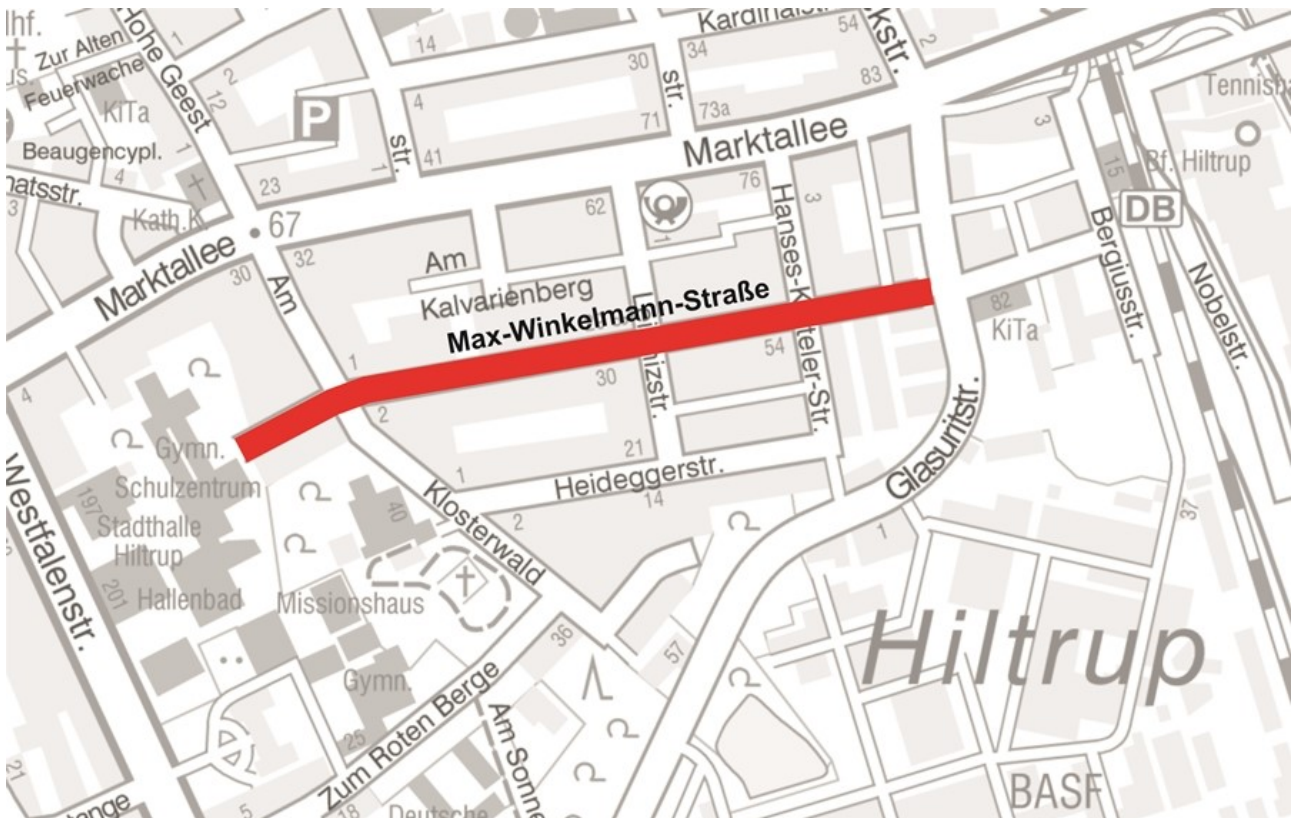
Abb. 1: Lage der Max-Winkelmann-Straße in Münster-Hilstrup

Die Max-Winkelmann-Straße verläuft südlich der Marktallee und verbindet auf direktem Wege den Bahnhof in Hilstrup mit dem Schulzentrum. Neben ihrer primären Funktion als Wohnstraße (Erschließungsstraße) zeigen sich weitere Nutzungsansprüche durch Praxen (Physiotherapie, Logopädie) und Dienstleistungen sowie Kfz-Parkraum für Anliegende und Bahnreisende. Darüber hinaus ist die Max-Winkelmann-Straße im Bestand bereits eine Fahrradstraße. Aufgrund dieser Aufgaben und Anforderungen hat sie – insbesondere zu Schulzeiten – eine hohe Bedeutung für den Rad- und Fußverkehr.