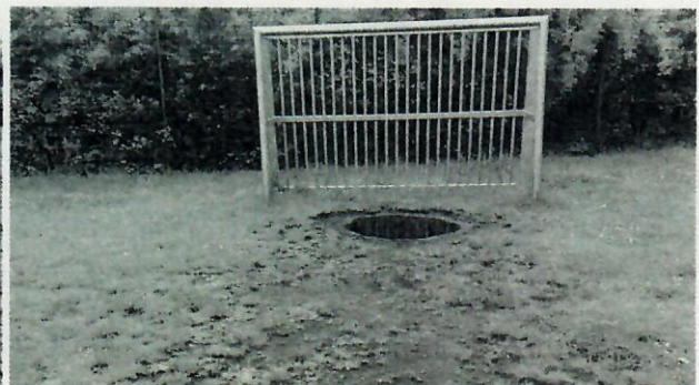
2. Bolzplatz Helene-Weigel-Weg: Sandsteine am Spielfeldrand sorgen für Unfallgefahr, die Rasenfläche ist sehr uneben und direkt vor den Toren bilden sich nach Schauern größere Pfützen.