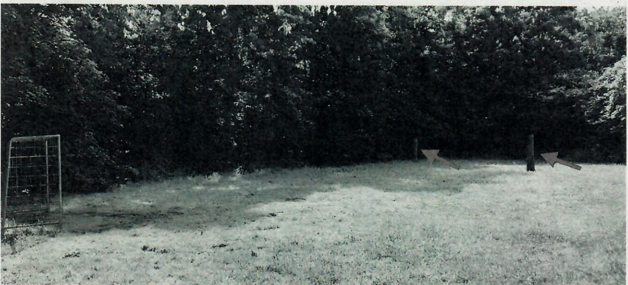
3. Bolzplatz Hiltruper See: Auf dem Platz befindet sich nur ein Tor und auf der gegenüberliegenden Seite des Platzes sorgen Holzpfeiler für eine erhöhte Unfallgefahr.