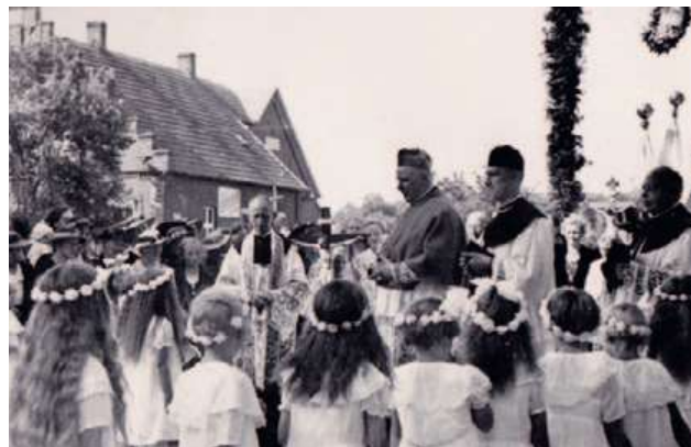
Abb. 101: Bischof Graf von Galen (Bildmitte) bei seinem Besuch 1938 in Albachten vor der Albachtener Kirche (links neben dem Kreuz Pfarrer Spieker)

Die Subdiakonsweihe war am 10. August 1905 5 , die Diakonsweihe am 23. Dezember 1905 6 , jeweils in Münster. Die Priesterweihe schließlich empfing er am 9. Juni 1906 (Donnerstag nach Pfingsten) im Hohen Dom zu Münster 7 aus der Hand des Bischofs Hermann Jakob Dingelstad (1835–1911).