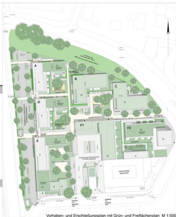
Vorhaben- und Erschließungsplan mit Grün- und Freiflächenplan M 1:500