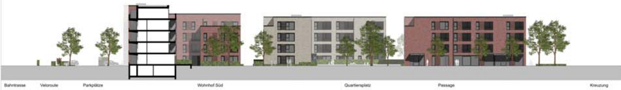
Ansicht von Süden / Schnitt durch die Passage