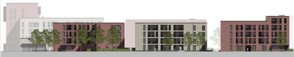
Ansicht von Norden (Holtmannsweg)