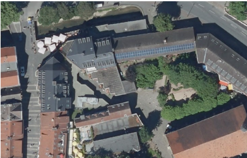
Foto: Hintere Dachseite im Bereich Bergstraße / Apostelkirche

Hintergebäude, welche sich i.d.R. dadurch auszeichnen, dass diese der Einsicht von der öffentlichen Verkehrsfläche entzogen sind, sind bei Beachtung des § 3 Absatz 1 (entspiegelt / blendfrei) ebenfalls einer Ausnahme und damit schon derzeit einer Zulassung nach pflichtgemäßen Ermessen zugänglich. Daher sind Hintergebäude und von der Straßenseite abgewandte Dachflächen auch diejenigen, wo bereits in der Vergangenheit Photovoltaikanlagen in der Altstadt zugelassen wurden.