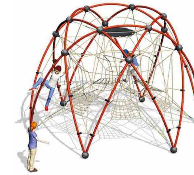
Kletternetz "Sirius", Fa. SMB