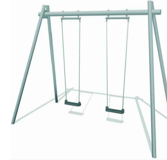
Stahl-Zweifachschaukel, Fa. FHS