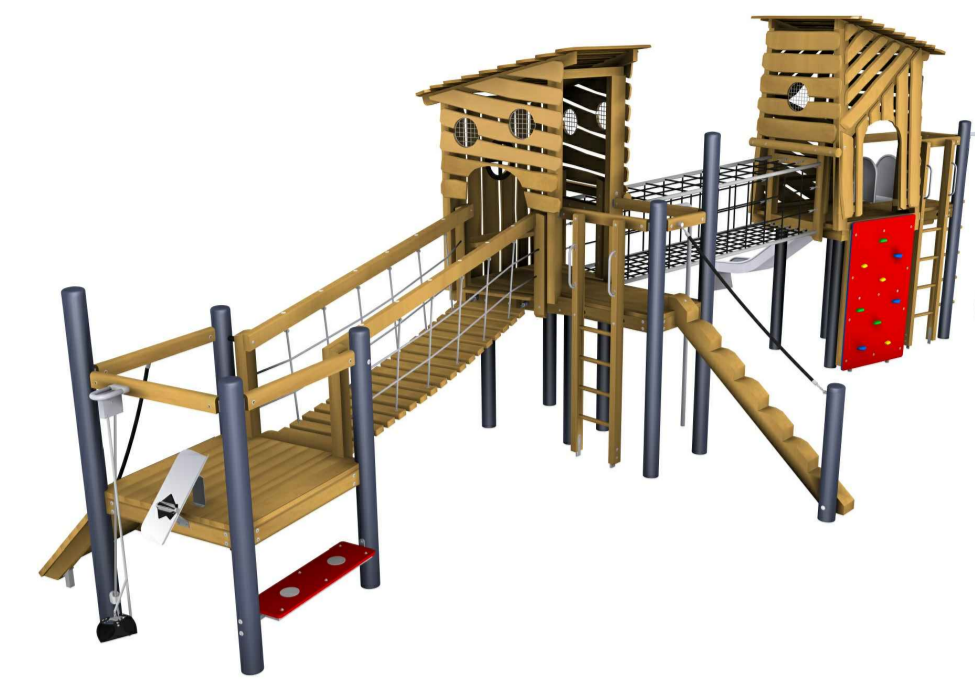
Pfahlhaus-Spielanlage, Fa. FHS