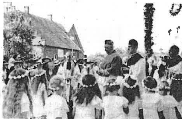
Abb. 101: Bischof Graf von Galen (Bildmitte) bei seinem Besuch 1938 in Albachten vor der Albachtener Kirche (links neben dem Kreuz Pfarrer Spieker)

Die Subdiakonsweihe war am 10. August 1905 5 , die Diakonsweihe am 23. Dezember 1905 6 , jeweils in Münster. Die Priesterweihe schließlich empfing er am 9. Juni 1906 (Donnerstag nach Pfingsten) im Hohen Dom zu Münster 7 aus der Hand des Bischofs Hermann Jakob Dingelstad (1835–1911).