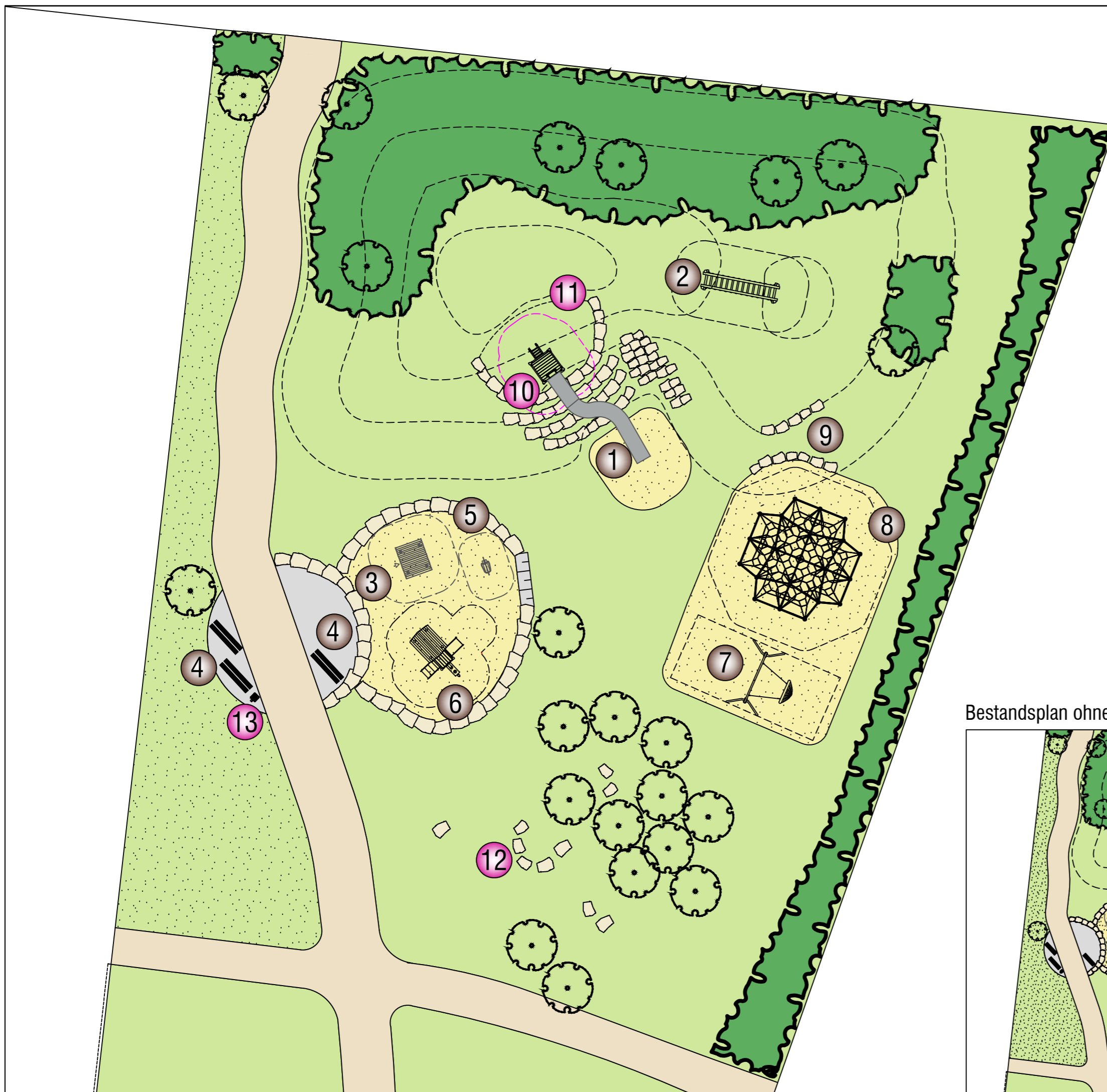
Bestandsplan ohne Maßstab