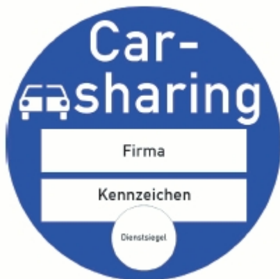
Abbildung 3: Plakette für Carsharing-Fahrzeuge

Die stationsbasierten Carsharing-Stellplätze werden, soweit möglich, im Rahmen der allgemeinen Verkehrsüberwachung durch das städtische Ordnungsamt überwacht. Alle parkberechtigten Carsharing-Fahrzeuge erhalten bei der Kfz-Zulassungsstelle eine Plakette, mit der das Fahrzeug zum Parken auf der für das jeweilige Fahrzeug vorgesehenen und zugeordneten Fläche berechtigt ist.