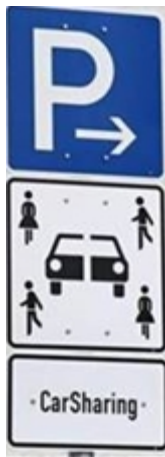
Abbildung 2: Verkehrszeichen 314 sowie Zusatz "CarSharing" zum besseren Verständnis des Carsharing-Symbols.

In Abstimmung mit der Verwaltung können die Anbieter an den ihnen zugeordneten Standorten zur zusätzlichen Vermeidung von Falschparkern einen Hinweis auf ihr Unternehmen anbringen, beispielsweise in Form eines Schilds oder einer Hinweistafel bzw. eines Hinweis-Dreiecks. Falls erforderlich, kann zusätzlich zur weiteren Vermeidung von Falschparkern durch die Verwaltung auch eine Bodenmarkierung auf den Stellplätzen aufgebracht werden.