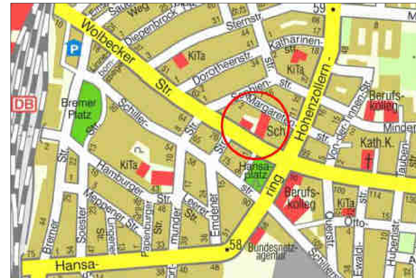
Überbergschule Lage im Stadtplan